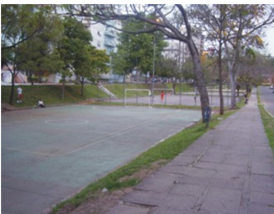
Figura 4: Presença de quadras esportivas e prédios residenciais no início do setor 2. Fonte: Trabalho de Campo. Autor: COSTA, E.R.da (26/10/2008).

As áreas ao redor são ocupadas por prédios residenciais, arbustos e árvores de porte médio à alto, além de gramíneas (Figura 6).