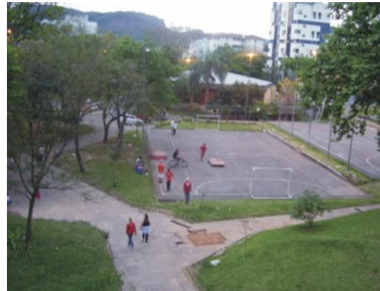
Figura 5: Final do setor 2. Fonte: Trabalho de Campo. Autor: COSTA, E.R.da (26/10/2008).