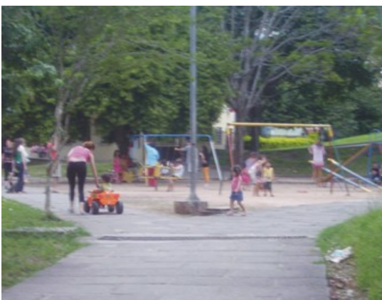
Figura 9: Pracinha Infantil no centro do setor 3.