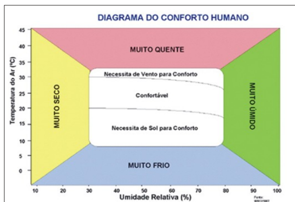
Figura 1: Diagrama do conforto humano.

condições de temperatura e umidade, dado pela seguinte fórmula: THI = T - 0.55 (1 - UR) (T - 14) , onde: T é a temperatura dada em graus Celsius e UR é a umidade relativa dada em fração decimal.