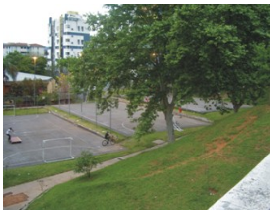
Figura 6: Presença de prédios residenciais, árvores e gramíneas ao redor do setor 2.

O início do Setor 3 próximo ao viaduto Heitor Campos apresenta-se afunilado e bastante arborizado (Figura 7). No final do Setor 3 há maior presença de gramíneas e poucas árvores (Figura 8) e de prédios no entorno tornando-o bastante sombreado. Este setor possui uma pracinha bastante freqüentada pelas crianças, conforme registrado na Figura 9.