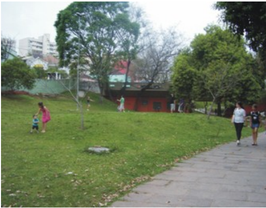
Figura 8: Final do setor 3 do Parque Itaimbé. Fonte: Trabalho de Campo. Autor.: COSTA, E.R.da (26/10/2008).