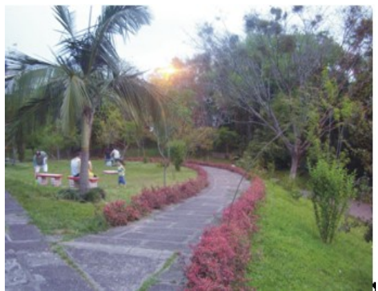
Figura 12: Arborização do setor 4. Fonte: Trabalho de Campo. Autor.: COSTA, E.R.da (26/10/2008).

O início do setor 4 encontra-se cercado de prédios e residências de dois a três andares (Figura 10). Além de banquinhos no canteiro central, possui uma concha acústica que serve para apresentações culturais, conforme Figura 11. É mais arborizado que o Setor 5, com presença de arbustos e árvores de porte médio a grande, conforme Figura 12.