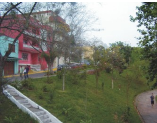
Figura 10: Presença de prédios ao lado do setor 4.

O início do setor 5 bem arborizado e coberto de gramíneas em sua parte central é cercado por prédios dos dois lados e as ruas que o bordeiam são pavimentadas por “unistein”, um tipo de pavimentação de cimento mais clara que o asfalto. Constitui-se em área de lazer, dada a presença de uma praça de recreação infantil, conforme Figura 13.