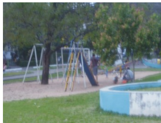
Figura 13: Praça para recreação infantil localizada no Setor 5 do Parque Itaimbé