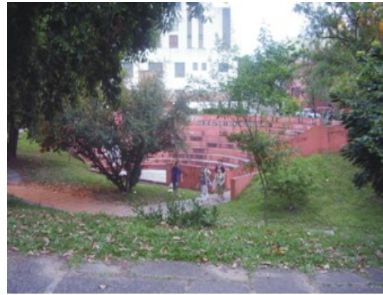
Figura 11: Concha acústica localizada no setor 4. Fonte: Trabalho de Campo. Autor.: COSTA, E.R.da (26/10/2008).