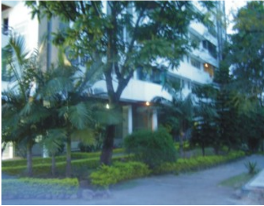
Figura 14: Final do setor 5 próximo a Avenida Nossa Senhora das Dores. Fonte: Trabalho de Campo. Autor.: COSTA, E.R.da (26/10/2008).

No final do Setor cinco, localizado no extremo sul do Parque, verificou-se a presença de áreas impermeabilizadas com concreto e presença de um prédio de 9 andares, além de árvores de porte médio à alto que contribuem para o sombreamento do local, conforme a Figura 14.