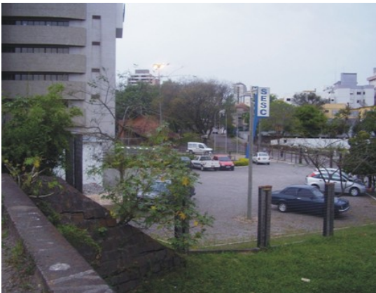
Figura 3: Presença de prédios residenciais no início do setor 1. Fonte: Trabalho de Campo. Autor: COSTA, E.R.da (26/10/2008).

O Setor 1 localizado no extremo norte do Parque Itaimbé é o menos arborizado e o mais impermeabilizado, caracterizando-se pela presença de prédios residenciais e institucionais como o do Serviço Social do Comércio (SESC), principalmente no seu trecho inicial, conforme mostra a Figura 3.