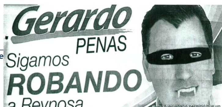
Figura número 2

En el mes de julio de 2007, apareció publicada en una revista, denominada “Hora Cero”, de circulación mensual (número 225, año 8) en Reynosa, Tamaulipas, con una imagen alterada de un ex candidato a la alcaldía de Reynosa, Tamaulipas del Partido Acción Nacional (PAN):