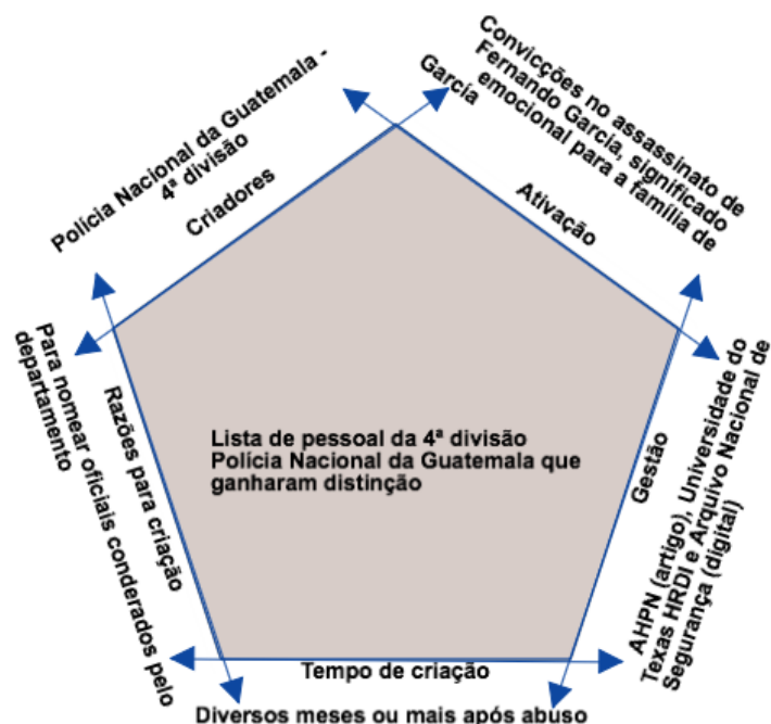
Figura 2: Modelo Visual do exemplo 1

mostraram que meu pai foi capturado pelas forças do estado, o que aconteceu, onde e quem estava envolvido... Eu penso em como meu pai se sentiria. Ele ficaria feliz por, finalmente, ver um pouco de justiça nesse país". 32