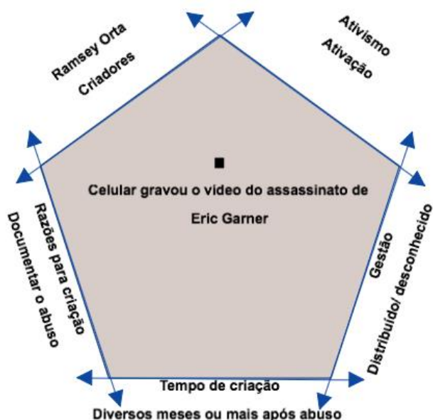
Figura 3: Modelo Visual do exemplo 2

Como esses dois exemplos mostram, os vetores funcionam como um dispositivo heurístico que fornece estrutura para se pensar o significado do termo "documentos de direitos humanos". Eles nos permitem pensar sistemática e criticamente sobre o significado desse termo, os tipos de documentos que se enquadram nessa categoria e seus diversos usos. Os exemplos fornecidos aqui não são exaustivos. Nossa esperança é de que os vetores permitam que outros analisem outros documentos criados e utilizados em diferentes contextos.