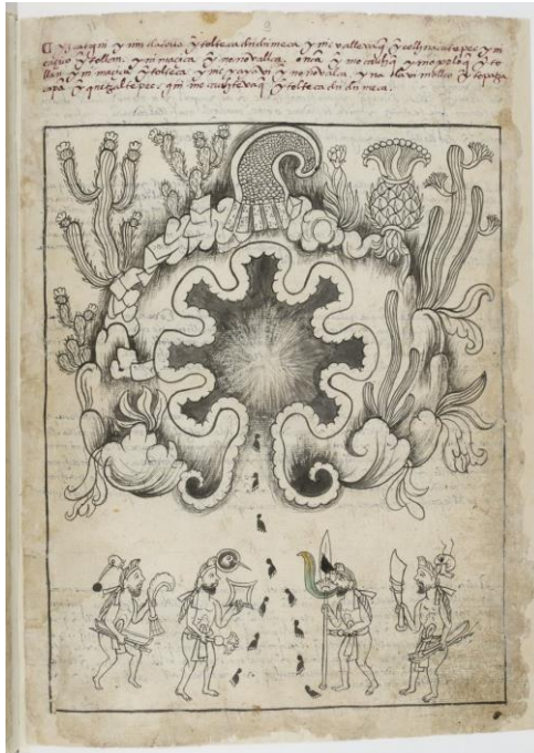
Figura 1 – Reprodução da caverna de Chicomoztoc, Historia Tolteca-Chicimeca . 10