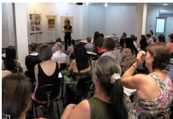
Figura 2 – Coordenadora do MAHP