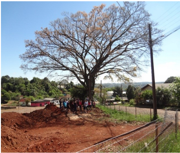
Figura 15 - Equipe Novo Olhar – EMEF Presidente Costa e Silva

A revista é um suporte para desencadear inúmeras atividades e é um primeiro passo para outras produções. Na primeira edição foram impressas 508 revistas com recursos do prêmio Darcy Ribeiro 2012 e na segunda edição 500 exemplares, com investimento da Prefeitura Municipal. Esta oportuniza a universalização do acesso as diferentes informações da história do Município de Panambi do período de 1898 a 1954, vivenciados nos diferentes contextos econômico, cultural, religioso, social e político, mantendo viva a memória do cotidiano. Segue imagens da revista e do dia do lançamento.