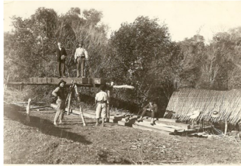
Figura 12 - Trabalhadores na construção de ponte. Foto 3.002.

Concomitantemente a este trabalho o MAHP desenvolve outro Projeto anual de ação educativa, que são as gincanas. No ano de 2013 o MAHP lançou a 5ª edição da Gincana, este desafiou numa das atividades a realização de pesquisa sobre a existência de árvores nativas do Bairro em que se localiza a Escola. A revista foi um dos desencadeadores da discussão, pois nela constam várias árvores nativas.