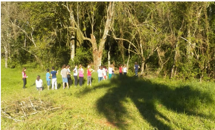
Figura 13 - Equipe Madizes – EMEF Madalena

Participaram da 5ª Gincana oito Equipes. O público alvo da Gincana eram os 4º e 5º anos do Ensino Fundamental. Uma das tarefas consistia em realizar uma pesquisa de campo com a finalidade de localizar, identificar, fotografar e confeccionar uma placa identificando uma árvore nativa. O local deveria ser próximo à escola onde a equipe pertencia. A seguir Figuras 13 a 15 onde alunos aparecem realizando o cumprimento da atividade.