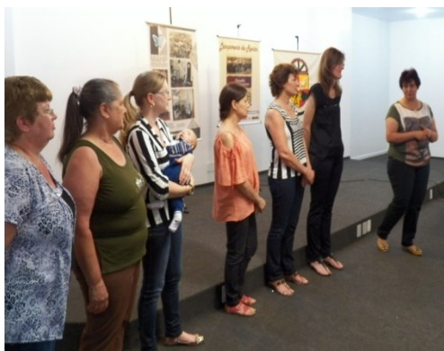
Figura 3 – Equipe do MAHP e SMEC