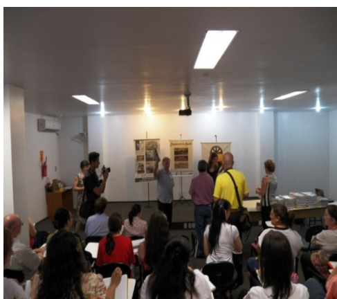
Figura 1 – Prefeito Miguel Schmitt-Prym - Momento da fala- Lançamento da Revista

O Lançamento oficial da Revista aconteceu no dia 27 de novembro de 2013, no salão de reuniões da Secretaria Municipal de Educação com a presença do Prefeito Municipal, do Vice-prefeito, da Secretária da Educação e Cultura, dos Meios de Comunicação, das Equipes Diretivas das Escolas Municipais, Convidados Especiais e Comunidade. As Figuras que seguem registram momentos do Lançamento Oficial da Revista.