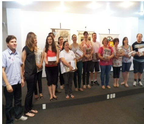
Figura 6 – Diretoras das Escolas de Ensino Fundamental recebendo exemplares da Revista

Neste dia foram entregues revistas para diretores das Escolas Municipais de Educação Infantil e das Escolas Municipais de Ensino Fundamental, para Convidados Especiais e Autoridades presentes no Evento.