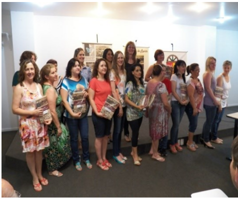
Figura 5 - Diretoras de EMEIS, recebendo exemplares da Revista