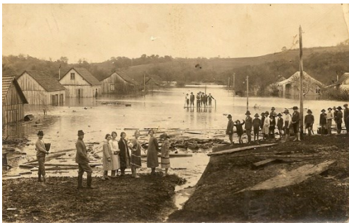
Figura 9 - Enchente na Rua Andrade Neves. 21.05. 1926. Foto 10.003.