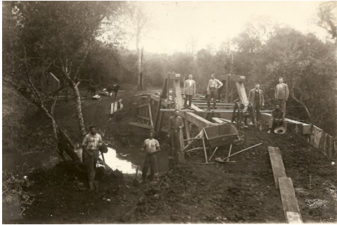
Figura 11 - Trabalhadores na construção da ponte sobre o rio Palmeira Foto 3.007 .