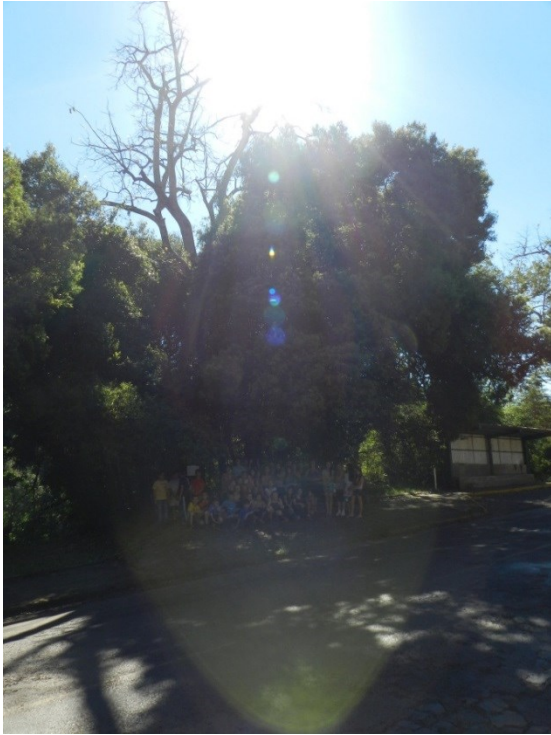
Figura 14 - Equipe Construtores da História, da Escola Estadual José de Anchieta