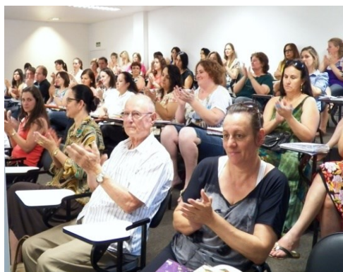
Figura 4 – Convidados Especiais e Comunidade