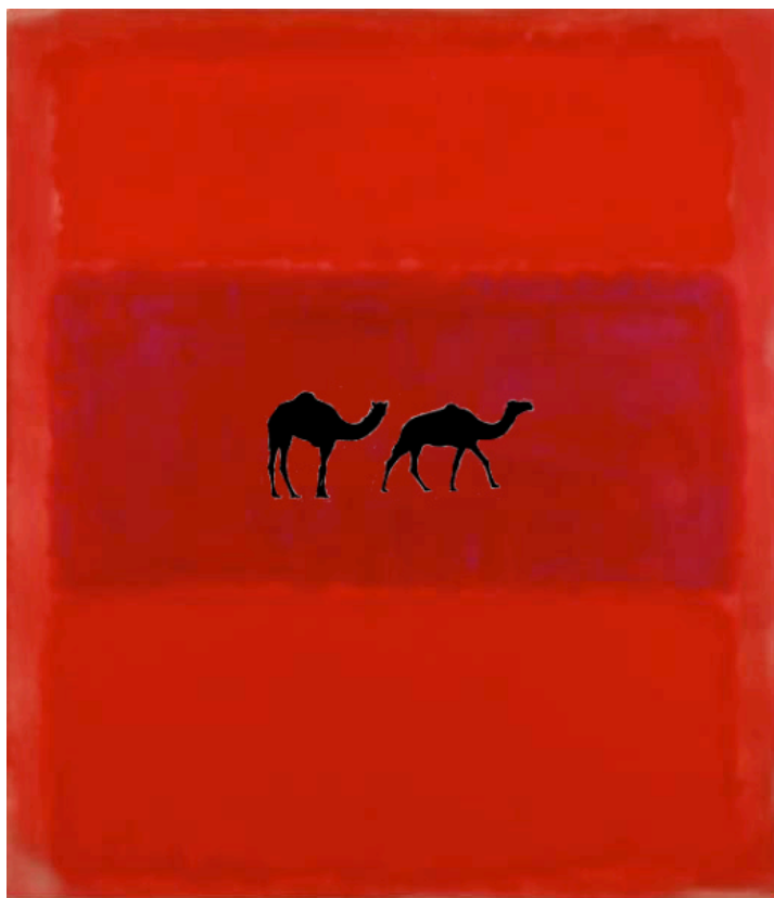
Figura por Mark Rothko, No. 301, 1959 (via Daily Rothko Tumblr Blog).

Lucio: Estou a pensar sobre estes camelos, eles não passam pela metamorfose? Será que ainda chegará o tempo deles...? Será que o grande meio-dia está por voltar sobre si mesmo, neste grande plano que estes caminham, sem um horizonte aparente? Estou incerto, parecem demasiados camelos! Subitamente camelos, perdidos a fio, carregando o peso de seu niilismo!