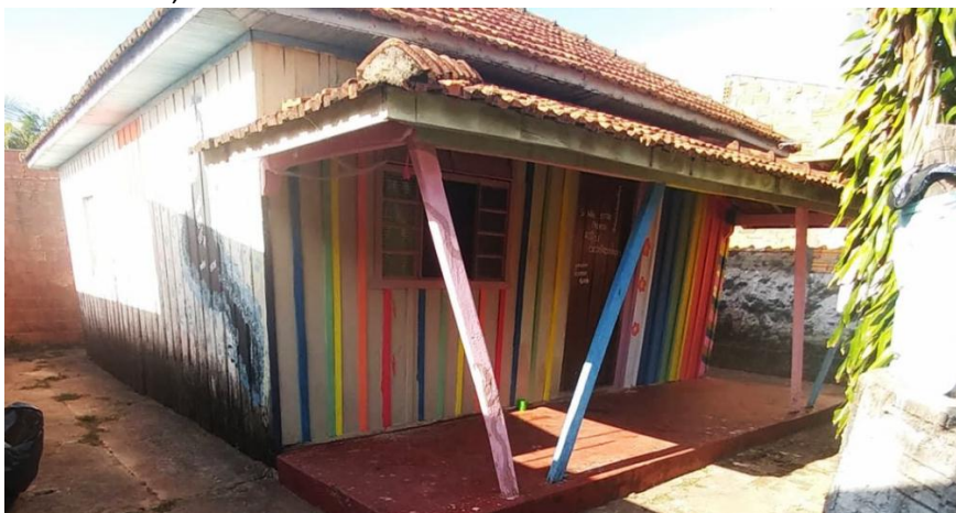
Figura 2: Varanda da CASASSA, localizada no bairro Vila Santa Tereza.

Matarazzo de Presidente Prudente. A partir daí, chegaram à conclusão que existia a necessidade de um projeto semelhante ao da Casa 1, localizado em São Paulo, na cidade.