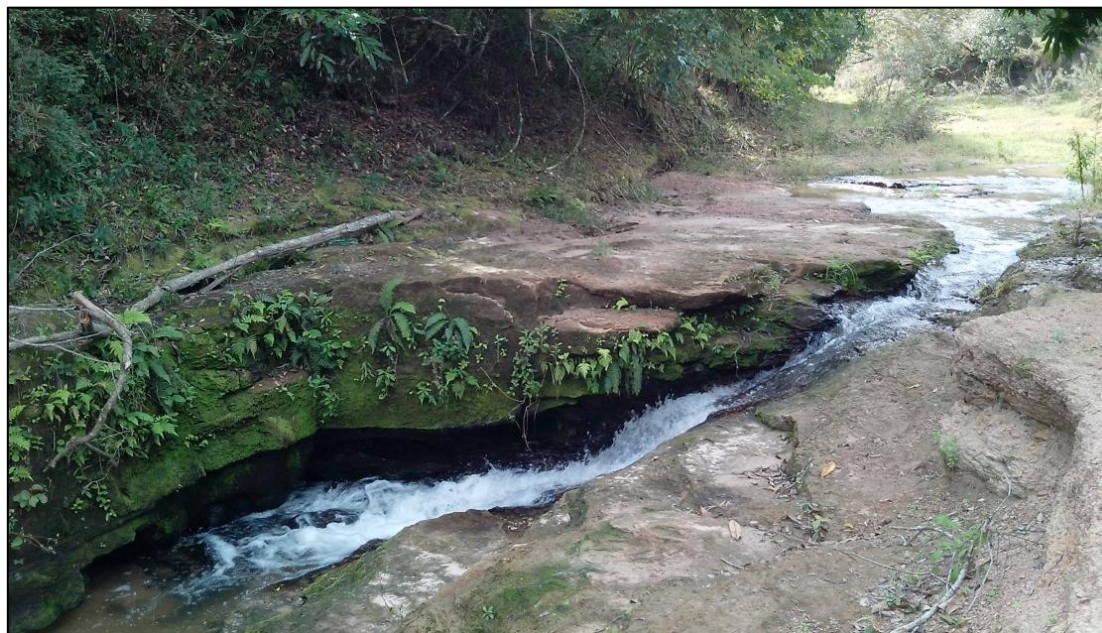
Figura 3. Corredeira decorrente de controle estrutural na bacia do córrego do São Pedro.

bacia do São Pedro, situado na porção Norte da cidade, quando há o encontro dos lineamentos de direção NW, NE e WSW, geralmente associados à confluência de seus tributários, é que condicionam a formação destas feições hidrológicas.