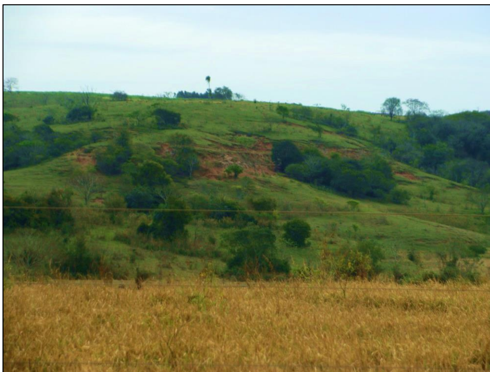
Figura 4. Ruptura do relevo e exposição do lençol freático suspenso.