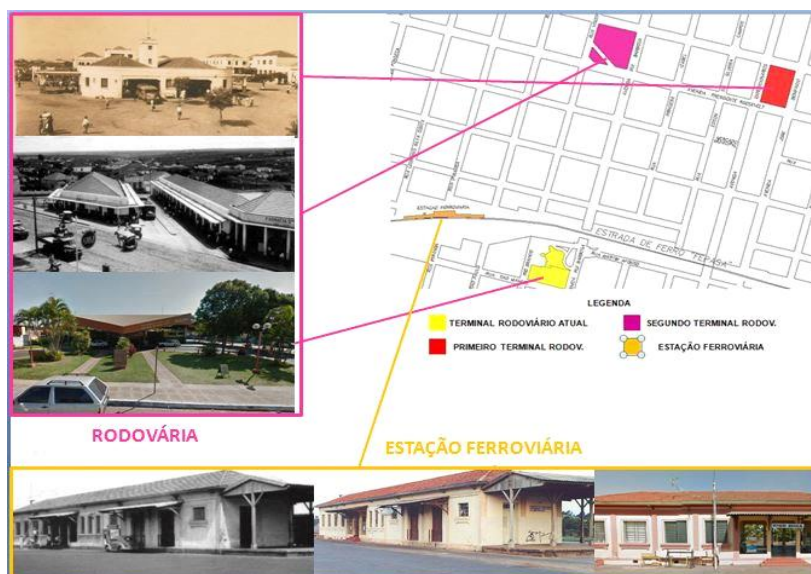
Figura 05. Situação atual das edificações históricas (1955 - 1960) do núcleo urbano inicial de Dracena.

neste cenário que chega o primeiro trem da Companhia Paulista de Estradas de Ferro, alterando a estrutura urbana de Dracena e contribuindo para sua evolução.