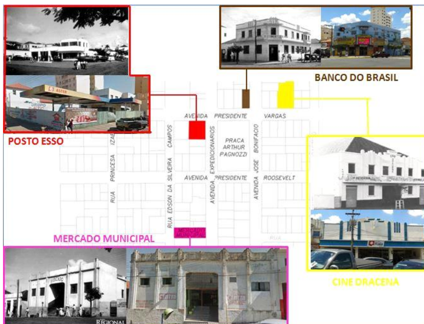
Figura 04. Situação atual das edificações históricas (1950 - 1955) do núcleo urbano inicial de Dracena.

Fonte: Base cartográfica fornecida pela Prefeitura Municipal de Dracena e editada pela autora.