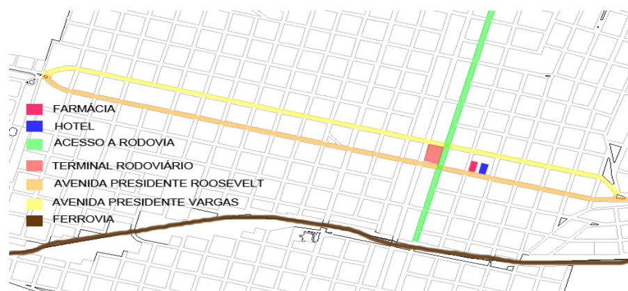
Figura 02. Localização do primeiro hotel e primeira farmácia.

Através do levantamento fotográfico, foi possível a elaboração de “mapas croquis” e comparações fotográficas afim de identificar o estado de preservação das edificações do centro histórico de Dracena. Para tal análise, foram estabelecidos quatro recortes temporais que representaram mudanças significativas na estrutura urbana da cidade. O primeiro recorte identifica os três primeiros anos da cidade, tendo como edificações importantes apenas o Hotel Municipal e a Farmácia, ambos edificadas em madeira (Figura 02).