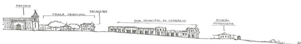
Figura 01. Cenário comum nas cidades fruto da expansão ferroviária do Oeste Paulista.