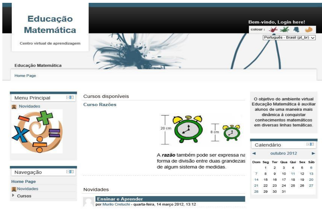
Figura 1 - Página Principal Moodle.

Uma plataforma do Moodle está em desenvolvimento na Fatec Ourinhos, São Paulo – Brasil, a fim de colaborar com o ensino e aprendizado da matemática dos alunos, utilizando o Geogebra como ferramenta auxiliadora desses saberes.