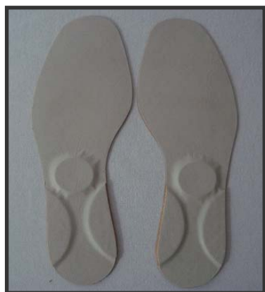
Figura 3. Palmilha proprioceptiva retropulsiva.

Em seguida, foram calçadas palmilhas proprioceptivas (Figura 3), com as quais os indivíduos deambularam por um minuto, posteriormente foram submetidos a uma reavaliação dos parâmetros baropodométricos e estabilométricos, ainda com as palmilhas e, por fim, uma última reavaliação, desses parâmetros imediatamente após a retirada das mesmas, foi realizada.