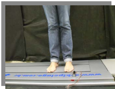
Figura 2. Figura representativa da coleta por meio de baropodometria eletrônica.

Em seguida, foram calçadas palmilhas proprioceptivas (Figura 3), com as quais os indivíduos deambularam por um minuto, posteriormente foram submetidos a uma reavaliação dos parâmetros baropodométricos e estabilométricos, ainda com as palmilhas e, por fim, uma última reavaliação, desses parâmetros imediatamente após a retirada das mesmas, foi realizada.