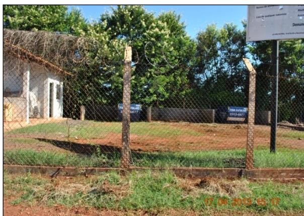
Figura 2. Estrutura física do ecoponto.