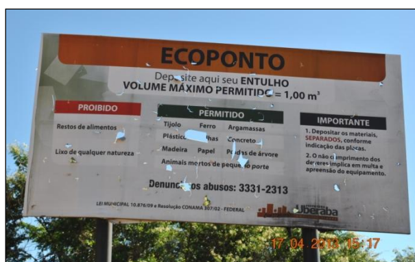
Figura 3. Sinalização dos tipos de resíduos a serem depositados.

população quanto à destinação dos resíduos (Figura 3).