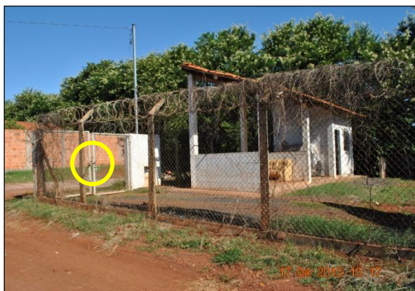
Figura 4. Ecoponto trancado.

melhor compreensão dos munícipes. Relatou-se por técnico da prefeitura e foi possível registrar, que alguns dos ecopontos permaneciam trancados em alguns momentos do dia (Figura 4).