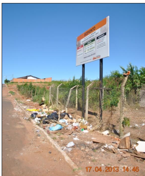
Figura 5. Disposição irregular de resíduos no entorno do ecoponto.

Desta forma a população depositava os resíduos nas proximidades do ecoponto e até mesmo frente à sua entrada (Figura 5).