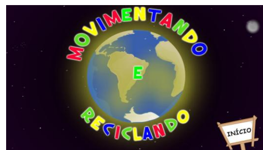
(b) Tela inicial do OA Movimentando e reciclando