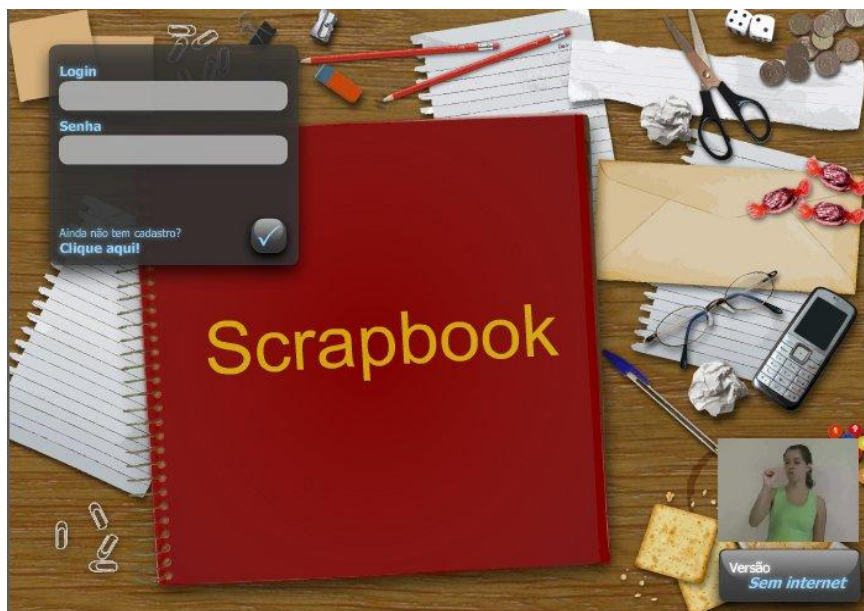
Figura 5. Descrição em LIBRAS no OA Scrapbook

LIBRAS (Língua Brasileira de Sinais), para atender pessoas alfabetizadas apenas na Língua Brasileira de Sinais.