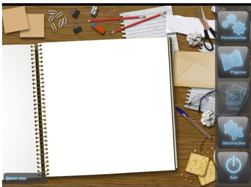
Figura 3. Tela principal do OA Scrapbook

Após a tela inicial do OA, o usuário é direcionado à área de desenvolvimento, ilustrada na Figura 3. Nela, todos os elementos gráficos decorativos são apresentados em categorias, incluídas em menus e submenus. O usuário pode navegar pelos menus, selecionando os objetos gráficos a serem inseridos, para então, posicioná-los na página como se queira. Dentre as categorias disponíveis estão: avatar, música, transporte, textos, entre outros.