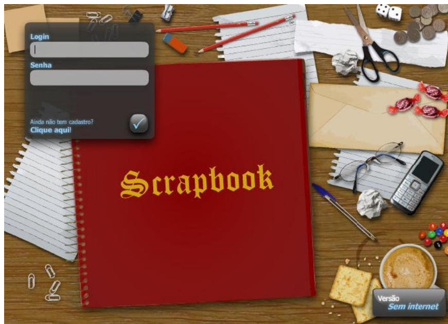
Figura 2. Tela inicial do OA Scrapbook

digital. No primeiro caso o software oferece algumas vantagens, como gravação do álbum. Ao iniciar o objeto o usuário deve se identificar utilizando login e senha, que pode ser visto na Figura 2. Neste modo, o usuário tem a opção de gravar o desenvolvimento de seu álbum, além disso, conta com a opção de carregar e inserir, imagens salvas em seu computador, o que lhe dá a liberdade de criar e utilizar figuras, montagens, objetos e até mesmo fotografias, inexistentes no banco de dados do programa.