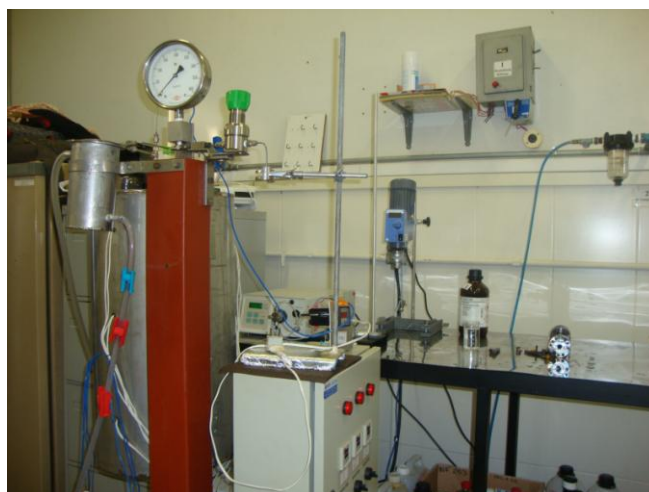
Figura 2. Aparato Experimental Laboratório de Tecnologia Supercrítica e Equilíbrio de Fases do Departamento de Engenharia Química da Universidade Estadual de Maringá.