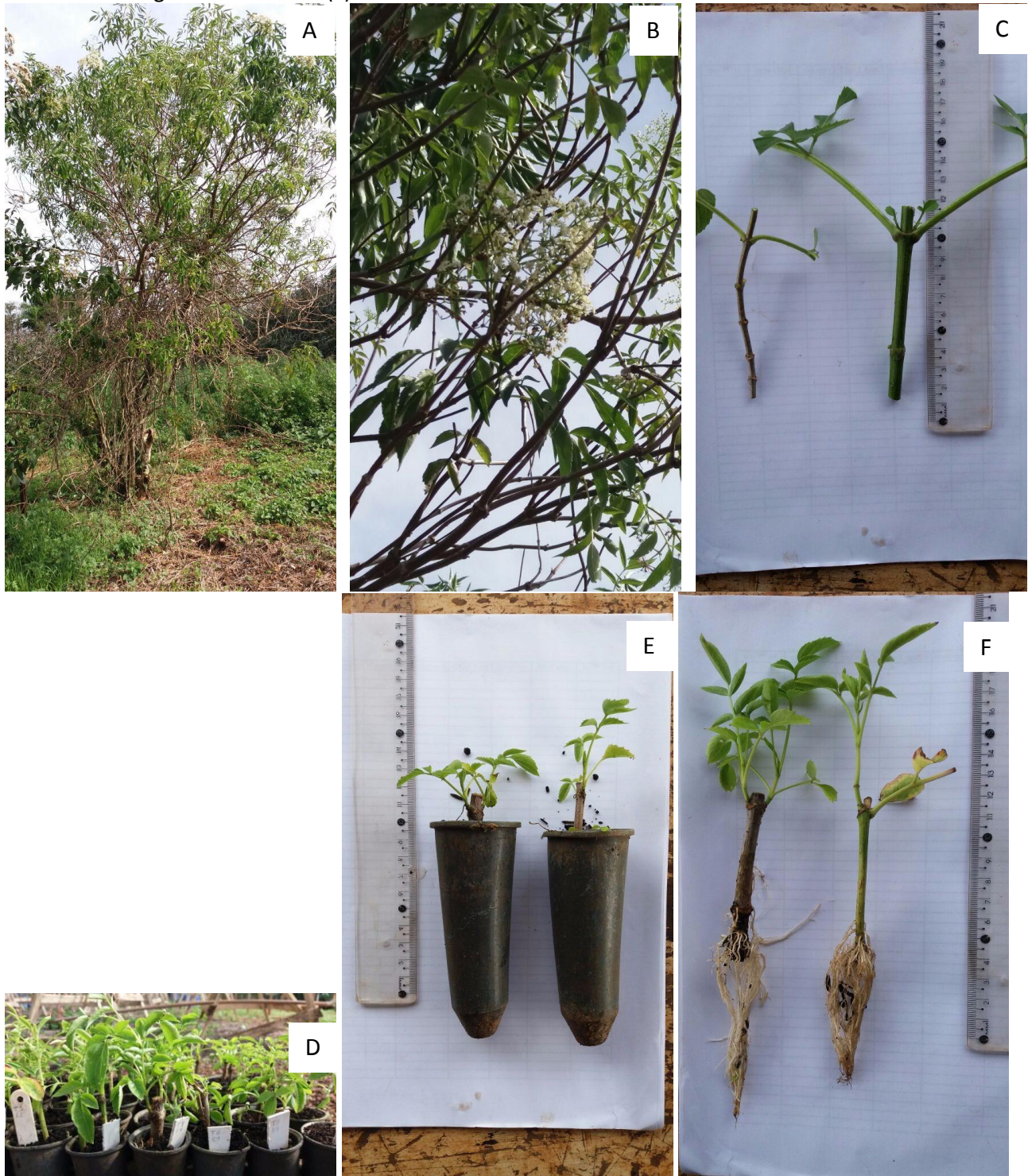
Figura 1. Planta de sabugueiro utilizada no trabalho (A), Planta de sabugueiro com flores (B), Estacas de sabugueiro prontas para serem colocadas nos tubetes (C), Estacas de sabugueiro já estaqueadas em tubetes de acordo com cada tratamento (D), Estacas de sabugueiro prontas para serem avaliadas (E) e Estacas de sabugueiro enraizadas (F).

colocadas novamente submersas em água para evitar a oxidação.