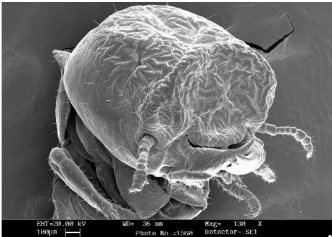
FIGURA 2: Fotografia em microscópio eletrônico de varredura de soldado de Cryptotermes brevis . As rugosidades na cabeça são características próprias da espécie. (Aumento de 130x)

O Bairro São Dimas não apresentou grande diversidade de espécies de cupins. Nas edificações residenciais e em seus móveis houve focos apenas de cupins de madeira seca, Cryptotermes brevis (Walker) (Figura 2).