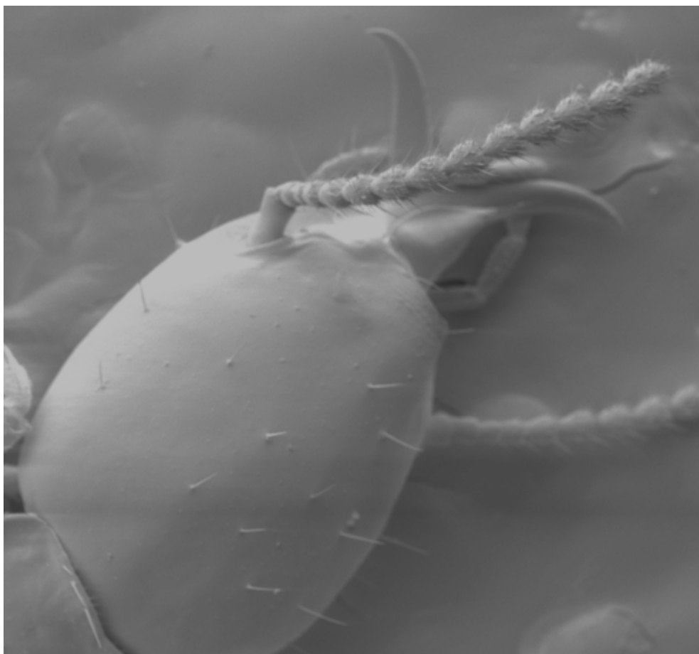
FIGURA 3: Fotografia em microscópio eletrônico de varredura de um soldado de Coptotermes havilandi (aumento de 40x).

presentes a espécie de cupim de madeira seca Cryptotermes brevis e a espécie de cupim subterrâneo Coptotermes havilandi (Holmgren) (Figura 3).