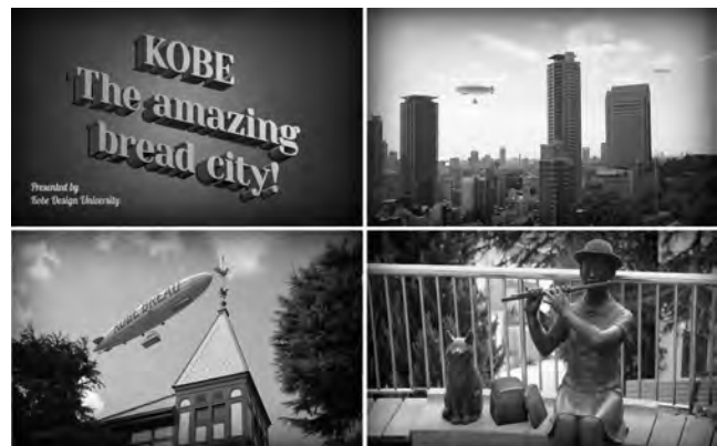
図3 映像作品『KOBE The amazing bread city!』03:26)