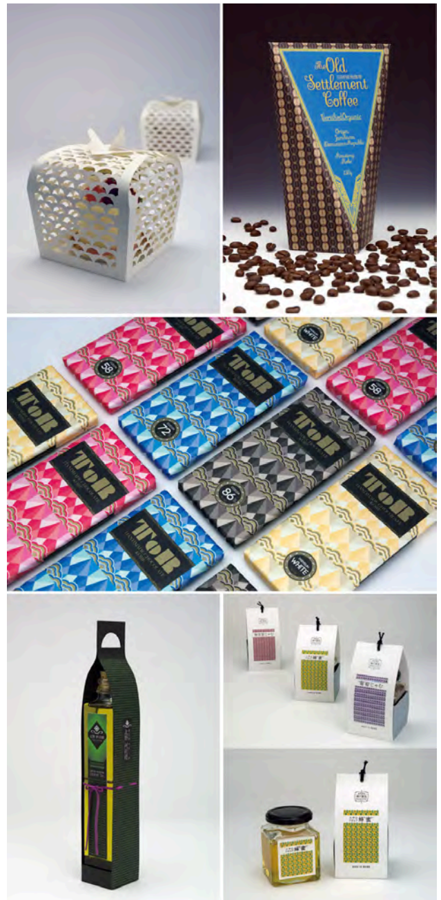
図5 パッケージ(左上①、右上②、中③、左下④、右下⑤)

パッケージデザインは本来、地域の食文化と密接に関係した磁力のあるデザインであり、都市のイメージを伝達するメディアにも成りえる重要度を合わせ持つ。企業各社がその時々市場ニーズに合わせて対処療法的に製品やパッケージをデザインする現状は、地域文化への悪影響や持続可能性の観点から、決して望ましいものではない。本項で示した成果は、都市の未来を見据えて、今、在るべきパッケージのかたちを模索した結果である。地球環境問題が叫ばれる一方で、ものが溢れる現代に、企業やデザイナーの責任は重大で、課題解決に向けての取り組みが望まれる。本項のまとめとして、制作したパッケージから地域文化を紹介するカタログ(図6)(タイトル:『KOBE MODERNISM NEO』)を制作した。