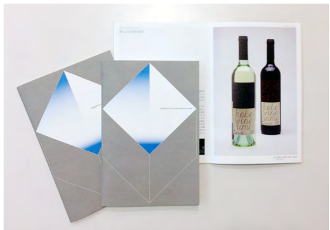
図6 冊子『KOBE MODERNISM NEO』(A5・32P・平綴じ)