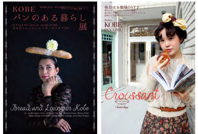
図2 告知ポスター(左)、展示作品『KOBE PAN GIRL』(右)