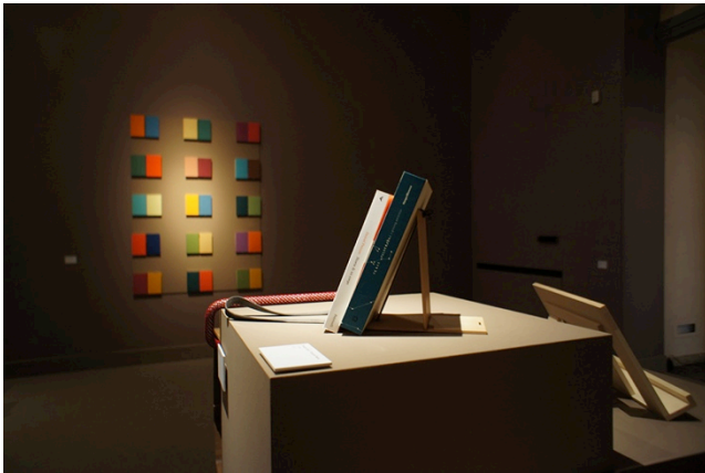
写真3 2013年4月にミラノの Museo Poldi Pezzoli で開催された「Around the Book」展における Design Soil 学生作品の展示風景。

その後、2013年6月1日から30日まで、大阪の大阪府立住まいのミュージアムで開催された関西の若手建築家、クリエイターの選抜展「住まいをデザインする顔」展