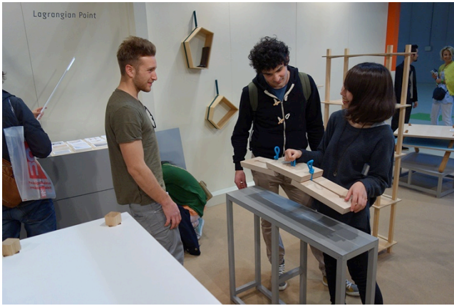
写真5 Salone Satellite 展示ブースで、来場者に英語で解説をする学生。