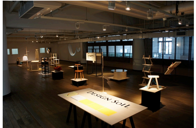
写真4 2013年7月の国際インテリアデザインシンポジウムにおける展示風景。

に出展者として招待された。ミラノサローネへの継続的な出展が評価されての招待である。また、2013年6月25日から7月2日まで、神戸芸術工科大学ギャラリーセレンディップにおいて、これまでの3年間の全作品を展示する作品展「The Soil of Design Soil」展を開催し、引き続き、2013年7月8日から14日まで、KIITO で開催された「国際インテリアデザインシンポジウム」会場内においても、同作品展を開催した。