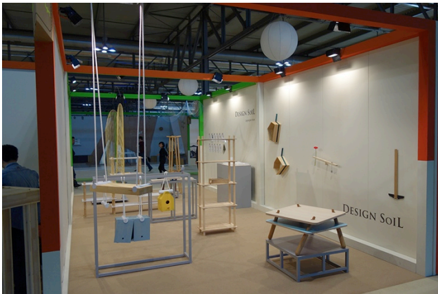
写真2 2013年4月の Salone Satellite 展示風景。

2012年のミラノサローネで展示をした作品についても反応があった。ひとつは、2013年のミラノサローネの時期にミラノの美術館 Museo Poldi Pezzoli で開催された、「本」をテーマにした企画展「Around the Book」展の出展作品に選定され、名だたるデザイナーの作品と共に展示された。別の作品は、香港の出版社 Victionary から出版された、世界中からキッズデザインの秀作を集めた作品集「Just Kidding」に掲載された。学生の作品がこれらの展示会に選定されたこと、出版物に掲載されたことは快挙であると言ってよい。