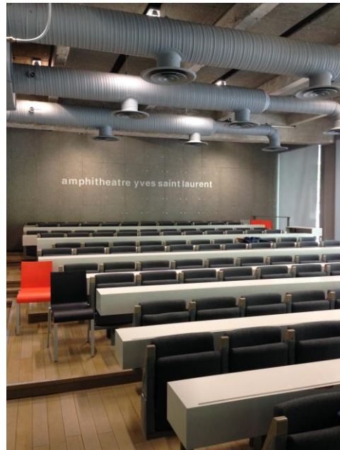
写真 13 サンローラン寄贈のレクチャールーム

そのような教育が行えるのは、同校がフランスの高等専門教育機関であるコンフェレンスデグランゼコールの一つに数えられ、その教育水準に高い評価を得ていること、パリというファッションの中心地にあるということ、また、前述したように、設立において産業のバックアップを受け、そのつながりが今も深いことが挙げられる。設立に大きく寄与したのは、イブ・サンローランの良きパートナーであったピエール・ベルジェであり、その縁でサンローラン寄贈のレクチャールームが学内に設けられていた(写真 13)。教育面でも述べたが、マネジメントが同校の基本になっていることも、企業を引き付け様々な提携を受けたプロジェクトを行いやすい点になっている。さらに企業を引き付ける点は、同校が単に教育機関というだけではなく、研究機関として、市場調査やその分析、マーケティングやトレンドなどについて多くの研究を行い、その成果を産業へ提供している点にある。年2回、独自の研究誌である『モードドゥルシャルシュ』を発行しているほか、トレンド分析についてなど特集ごとに様々な研究誌の出版や企業へのセミナーを行っている。