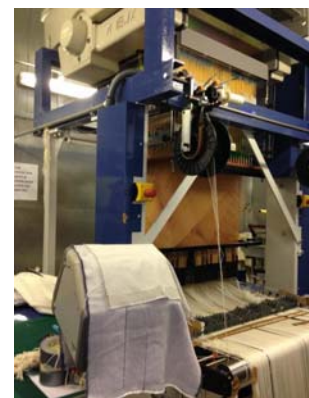
写真4 ジャガード織機