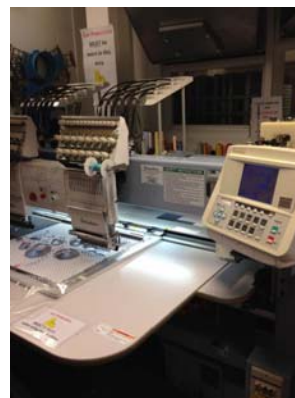
写真3 刺繍ミシン室