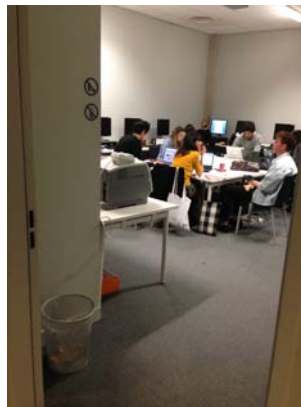
写真9 ミーティング風景

同校の教育で最も特長的であるのは、教育カリキュラム上のプロジェクトの多くが企業と提携して行われていることである。当初より、マネジメントの教育機関であった同校らしく、教育上のプロジェクトとはいえ、いかにビジネスとして成り立つかという視点を基本に実施されている。プロジェクトに臨むチームについても、マネジメントコースとデザインコースの学生がチームを組み、ビジネス上でのチーム同様に、ビジネスとクリエイションに携わる学生双方が共同でプロジェクトを進めていく形式になっている。ただ単にモノを作るだけでなく、マーケット規模や原価などを踏まえたビジネスとしての損益、そしてプロモーションの仕方まで、実践同様にチームとしてプロジェクトを進めていくのである(写真9)。訪問時には、エントランスに飾られていたディズニーとの共同プロジェクトの成果を見せていただいた。作品は、実際にディズニーストアで販売できるよう工場での縫製のしやすさを考えた仕様や原価率なども踏まえてデザインされていた(写真10~12)。