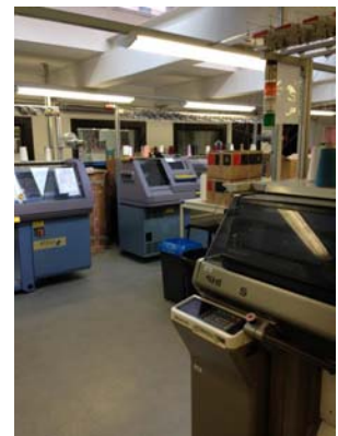
写真2 自動ニット室