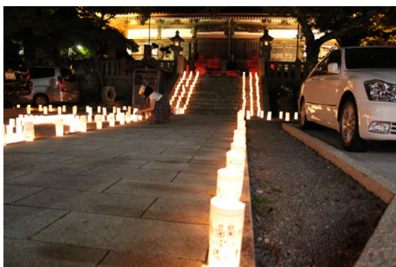
図4 有馬温泉ゆけむり大学「ねがいの灯り LOVE&PEACE」