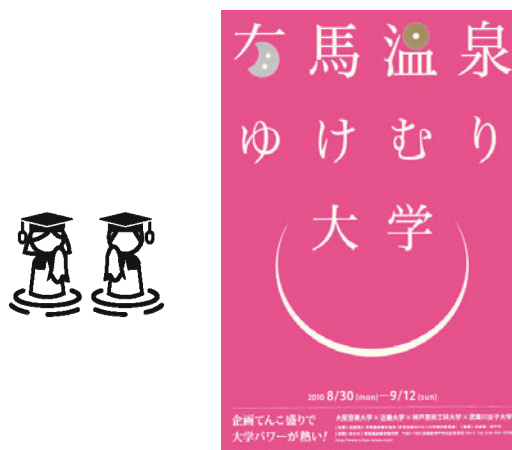
図2 有馬温泉ゆけむり大学「校章」・「チラシ」 開学式 演台前「ポスター」

ファッションデザインの実践では、前出大学の制服としてTシャツを採用し、ファッションデザイン学科学生たちが、デザイン及び本学のスタジオにてプリント作業を行った。（図3）