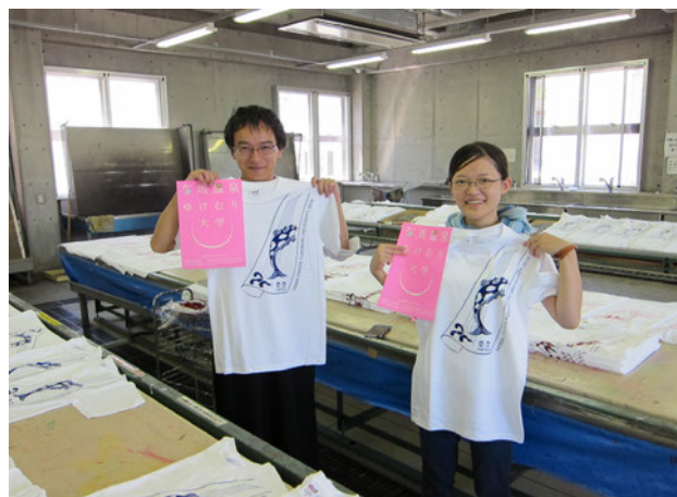
図3 有馬温泉ゆけむり大学「Tシャツ」

ファッションデザインの実践では、前出大学の制服としてTシャツを採用し、ファッションデザイン学科学生たちが、デザイン及び本学のスタジオにてプリント作業を行った。（図3）