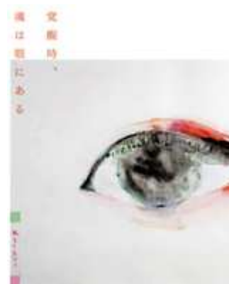
図2) ローズプラスエクス 1号 特集扉画：寺門孝之