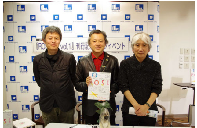
図6) vol.1 イベント

1号、2号の発刊を記念するトークイベントが、書店、及びブックカフェの主催として開催され、多数の入場者を得て刺激的な議論が交わされた。