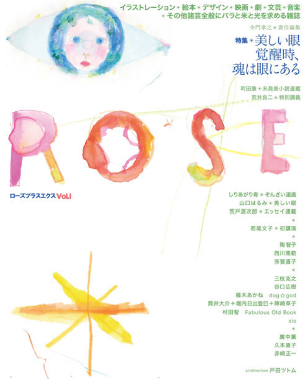
図1) ローズプラスエクス 1号 表1