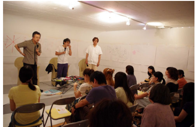
図9) 参加者からの「かゆい、を描いてみて欲しい」という要望に立ち尽くす3人。

の力を再確認できたイベントとなった。その内容については次号「ローズプラスエクス」に掲載を予定している。