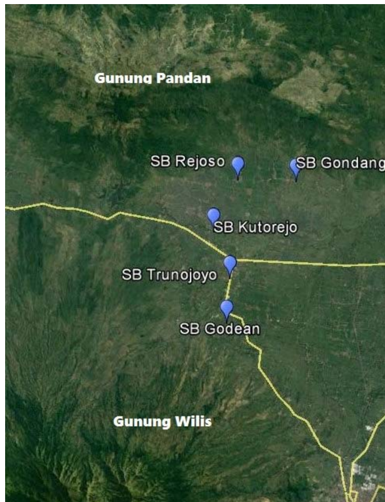
Gambar 1. Peta lokasi pengambilan sampel air tanah PDAM Kabupaten Nganjuk