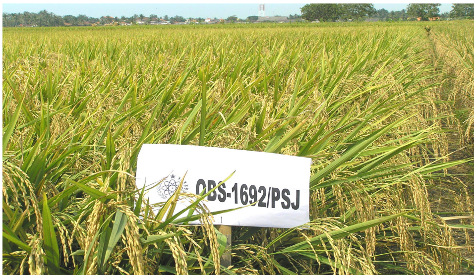
Gambar 3. Penampilan tanaman galur mutan Obs-1692/PsJ di Pusaka Negara, Subang, musim tanam MK 2006