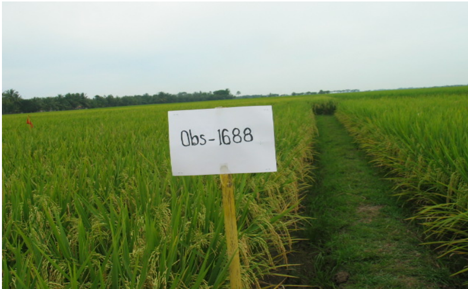
Gambar 1. Penampilan tanaman galur mutan Obs-1688/PsJ di Pusaka Negara, Subang, musim tanam MK 2005