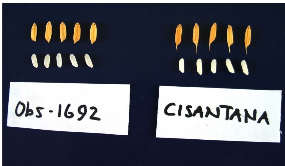
Gambar 4. Penampilan gabah dan beras galur mutan Obs-1692/PsJ