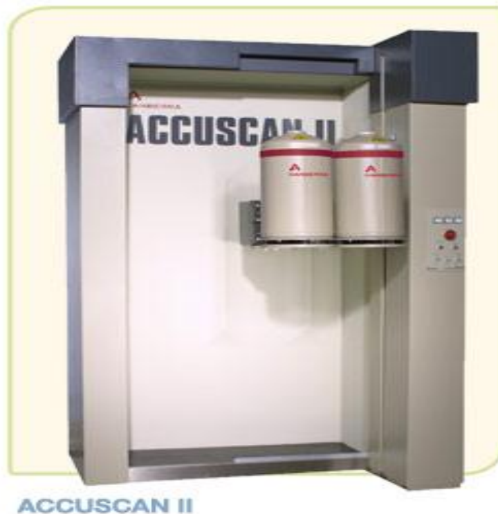
Gambar 3. Alat WBC

Di gambar tersebut terdapat ruangan-ruangan yang dipergunakan untuk aktivitas sehari-hari selama bekerja di IRM. Untuk penerimaan dosis radiasi eksternal dipergunakan TLD yang setiap tiga bulan dilakukan evaluasi dan pembacaan dosis yang diterima. Untuk penerimaan dosis internal dipergunakan alat Accuscan II seperti dalam Gbr. 3 dan pemeriksaan urine in-vitro ).