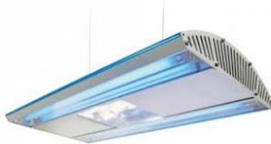
Gambar 1. Armature lampu TL [3]

Untuk penerangan langsung yang biasa digunakan pada bengkel, gudang-gudang, ruangan iradiator biasanya digunakan armatur, berikut ini adalah contoh gambar Armature lampu TL .