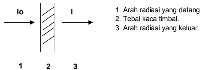
Gambar 2. Mekanisme penyerapan radiasi

Kaca timbal berfungsi untuk melindungi kamera dan peralatan elektronik lain dari paparan sinar-X tetapi kemampuannya untuk meneruskan cahaya masih sesuai standar yang ditentukan. Sebagai perisai radiasi, penyerapan ini tidak lain adanya interaksi radiasi sinar-X dengan unsur pembentuk senyawa kaca timbal, yang berakibat terpindahkannya energi radiasi kepada unsur tersebut. Mekanisme penyerapan radiasi oleh kaca timbal dapat dijelaskan sesuai Gambar 2.