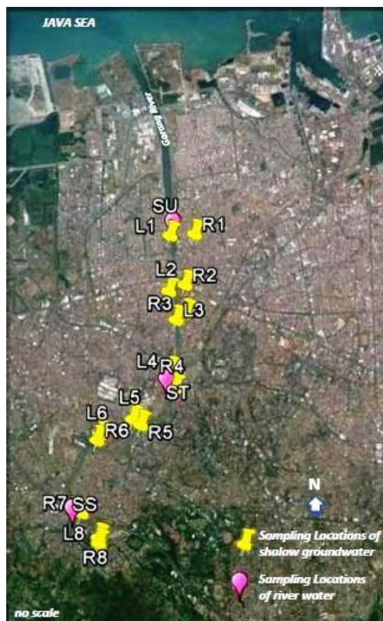
Gambar 2. Lokasi pengambilan sampel.