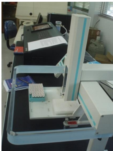
Gambar 1. Liquid water isotope analyzer LGRDLT-100.