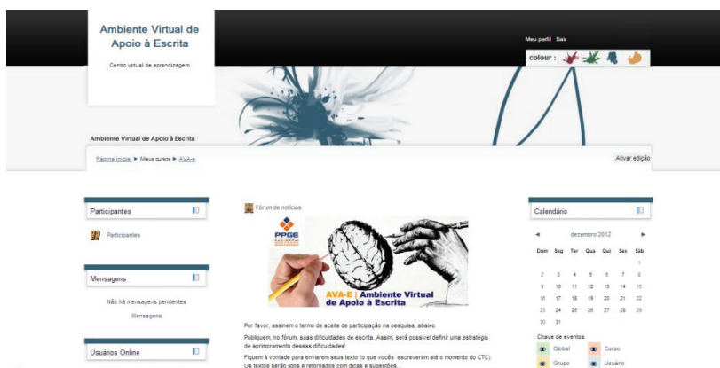
Figura 3 – Layout AVA-e: Ambiente Virtual de Apoio à Escrita

O foco das incursões esteve centrado em dificuldades de escrita detectadas previamente nos textos de Annia, Branka e Yeva: organização macroestrutural, uso de articuladores textuais e pontuação. O AVA-e continha dois espaços de interação: um Fórum Geral e um espaço destinado ao envio de arquivo/feedbacks, pelo qual as acadêmicas postavam versões do TCC e recebiam os feedbacks. As acadêmicas foram formalmente orientadas por tutoras a distância do curso de Pedagogia e, paralelamente, por meio do AVA-e, com o pesquisador, tinham a oportunidade de trabalhar mais profundamente a parte escrita (sem desvincular forma de conteúdo). Nos feedbacks sobre os TCC, fora usado o mesmo sistema de cores utilizado nas intervenções 2 e 3. Nesta intervenção, foi possível realizar o trabalho intenso sobre os textos de Annia, Branka e Yeva – culminando nas versões finais de seus TCC.