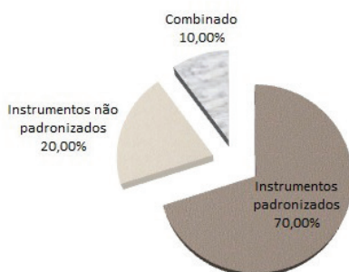
Figura 1. Gráfico referente às formas de avaliação do comportamento adaptativo para pessoas com deficiência intelectual.

Na Figura 1 é possível compreender a predominância de instrumentos padronizados (70%), n=42, seguido da avaliação não padronizada (20%), n=12. Sendo 10% (n=6) os estudos que empregaram a avaliação de forma combinada (instrumento padronizado e não padronizado).