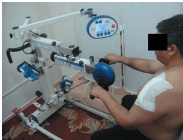
Рис. 5. Занятия больного после остеосинтеза левой плечевой кости на аппарате «Мотомед летто-2»

Динамику послеоперационного отека ежедневно измеряли по изменению длины окружности в области перелома после операции.