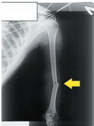
Рис. 1. Рентгенограмма диафизарного перелома левой плечевой кости