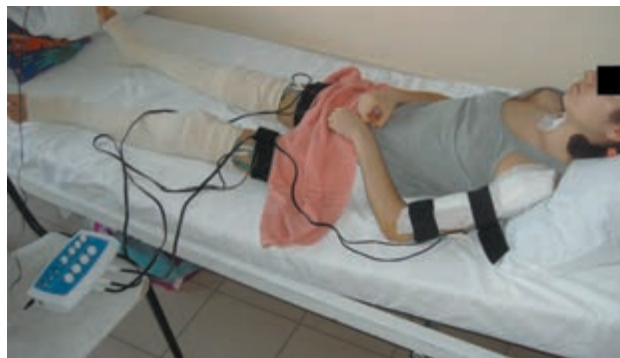
Рис. 4. Электростимуляция левого плеча у больной после остеосинтеза плечевой кости блокируемым штифтом

Эффективность разработанной методики оценивали по клинической картине, данным гониометрии (рис. 7), которую проводили с помощью стандартного угломера в процессе лечения, а также по результатам инфракрасной термографии [14].