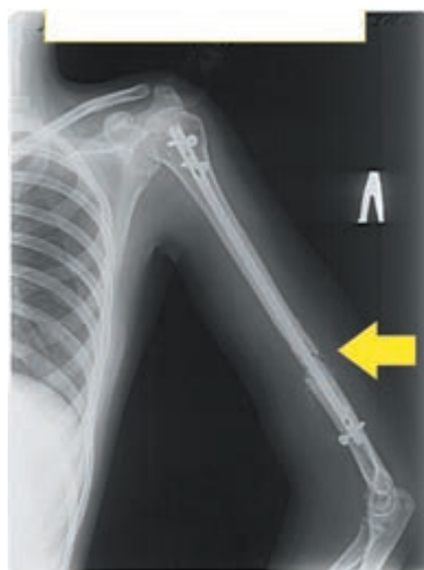
Рис. 2. Рентгенограмма левой плечевой кости после остеосинтеза блокируемым штифтом

метод прерывистой пневмокомпрессии (ППК) (рис. 3) нашим больным. Принцип действия ППК заключается в переменной внешней компрессии тканей конечности с помощью пневматической манжеты, что приводит к стимуляции венозного кровотока и лимфооттока конечности, усилению фибринолиза и уменьшению вязкости крови. Существующие аппараты ППК различаются силой компрессии (до 180 мм рт.ст.), количеством секций (камер) в манжете и их взаимодействием (изолированные камеры — последовательный тип пневмокомпрессии, связанные — градиентный), числом манжет, режимами работы («бегущей волны» и локального вибрационного воздействия) [7, 8].