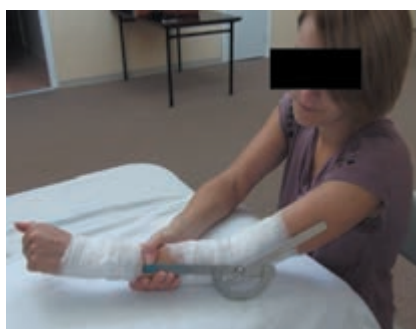
Рис. 7. Гониометрия локтевого сустава после занятия лечебной гимнастикой