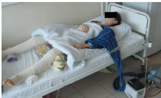
Рис. 3. Пример методики прерывистой пневмокомпрессии левой плечевой кости у больной после остеосинтеза плечевой кости блокируемым штифтом

Электростимуляцию мышц (ЭС) поврежденной конечности проводили со 2-х суток после операции