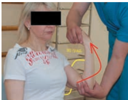
Рис. 6. Лечебная гимнастика у больной с переломом плечевой кости

Болевой синдром оценивали с помощью визуальной аналоговой шкалы (ВАШ), представляющей прямую линию длиной 10 см. Больные самостоятельно определяли свои болевые ощущения и отмечали их интенсивность точкой на шкале. Каждый сантиметр шкалы приравнялся к 1 баллу интенсивности боли, а итоговый результат вычисляли по суммарной длине отрезка, т.е. от 0 баллов до 10 баллов (нет боли — максимально возможная боль) [15].