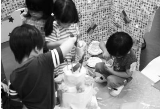
写真3) 巨大迷路「わくわく大冒険」子どもが遊んでいる写真