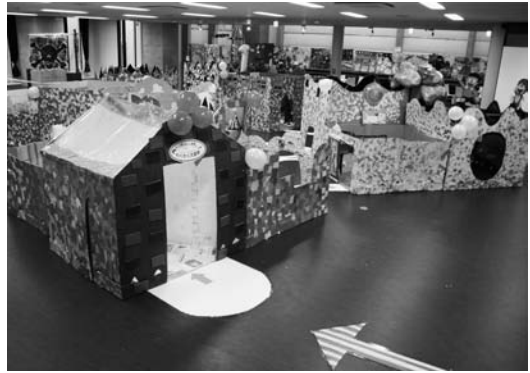
写真2) 巨大迷路「わくわく大冒険」展示写真

外装は子どもたちが制作に関われるように、ちぎり絵で表現した。色彩をブロックごとに、単色の赤、青、黄、緑で空間を分けることで、子どもの認識しやすい遊び場となるように試みた 写真2) 。