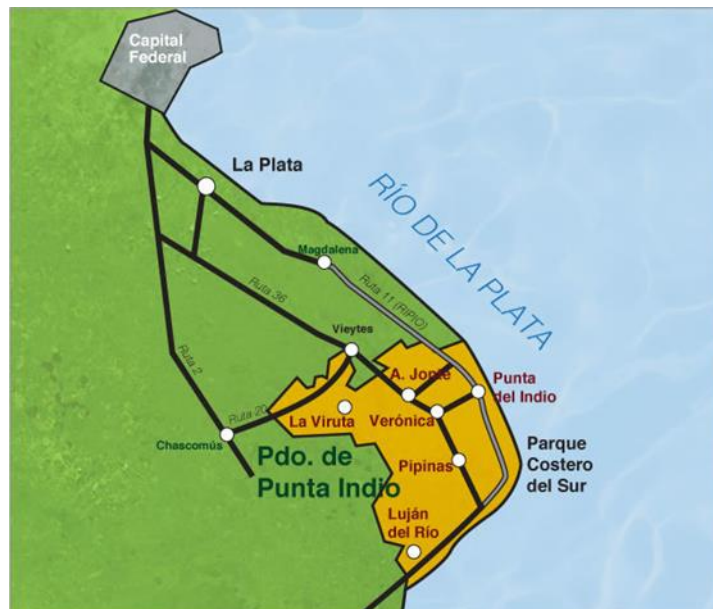
Figura 1: En amarillo está el Partido de Punta Indio, donde se ubica el parque y las ciudades que lo rodean.

De las 444 áreas protegidas de Argentina 15 son Reservas de Biósfera 11 , y una de esas es el Parque Costero del Sur. Declarado por UNESCO como Reserva Mundial de Biósfera (MaB UNESCO) en 1984 12 , el dicho parque está ubicado a 60 km al sur de la ciudad de La Plata, en el Partido de Punta Indio, provincia de Buenos Aires, Argentina, y tiene como ciudad cabecera la localidad de Verónica. Abarca una franja de 5 km de ancho por 70 km de largo sobre el margen del Río de La Plata, con 35.000 hectáreas de extensión (Figura 1).