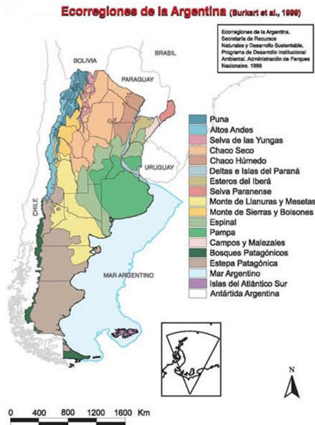
Figura 2: Ecorregiones de la Argentina

Su superficie se encuentra en la eco-región Pampa 13 y concentran una biodiversidad única, típica de la franja costera rioplatense, compuesta de paisajes exclusivos tanto en sentido estético cuanto ecológico (Figura 2).