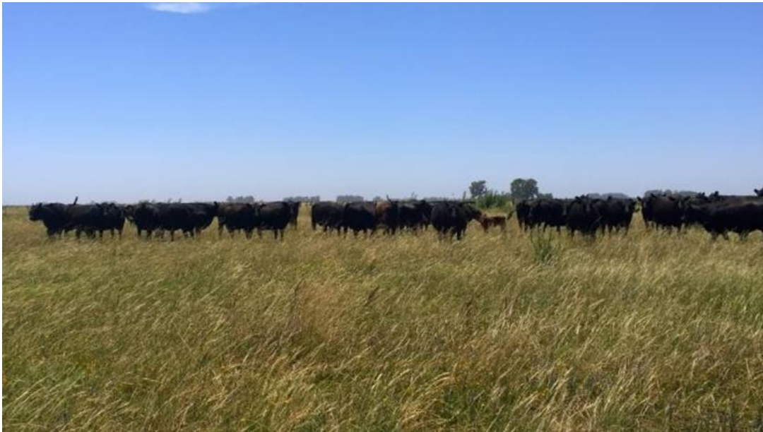
Figura 4: Vacunos en la pampa húmeda y forraje

En acuerdo con Burkart et al. 16 la formación vegetal originaria característica de esos campos es el pastizal templado dominado por el flechillar (con predominancia de Nassella neesiana ), de alta palatabilidad ganadera. Allí están la Stipa , Piptochaetium , Bromus , entre otras gramíneas (Figura 4).