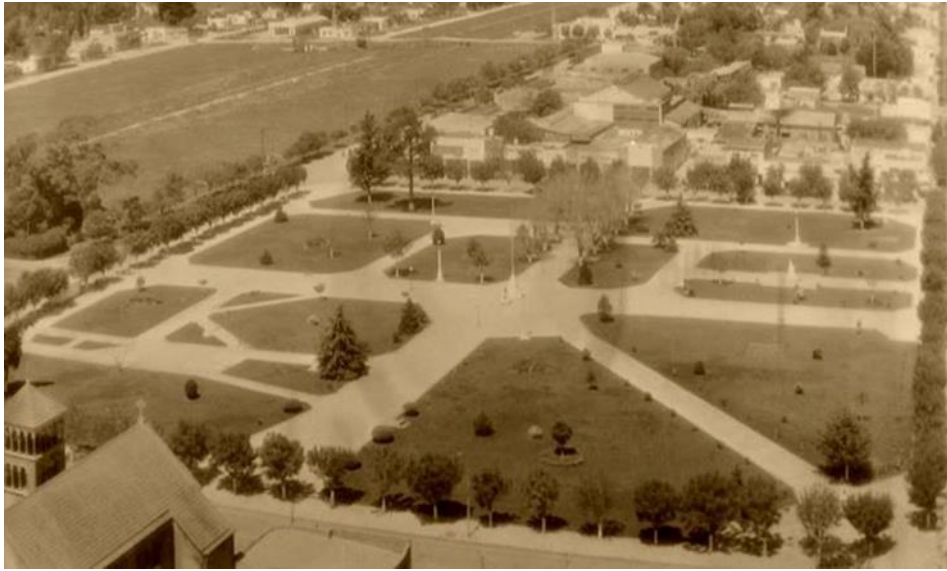
Figura 6 Ciudad de Verónica en los principios de los años 60.

En la foto se puede ver claramente que árboles fueran plantadas, algunas exóticas, como los piños, en las vías urbanas. Podríamos tomar la presencia de esos árboles como una especie de indicador de la “civilización” en la llanura, donde las líneas geométricas de las vías cortan la amplitud del pampa y son ornamentadas con vegetaciones en su mayoría no nativas.