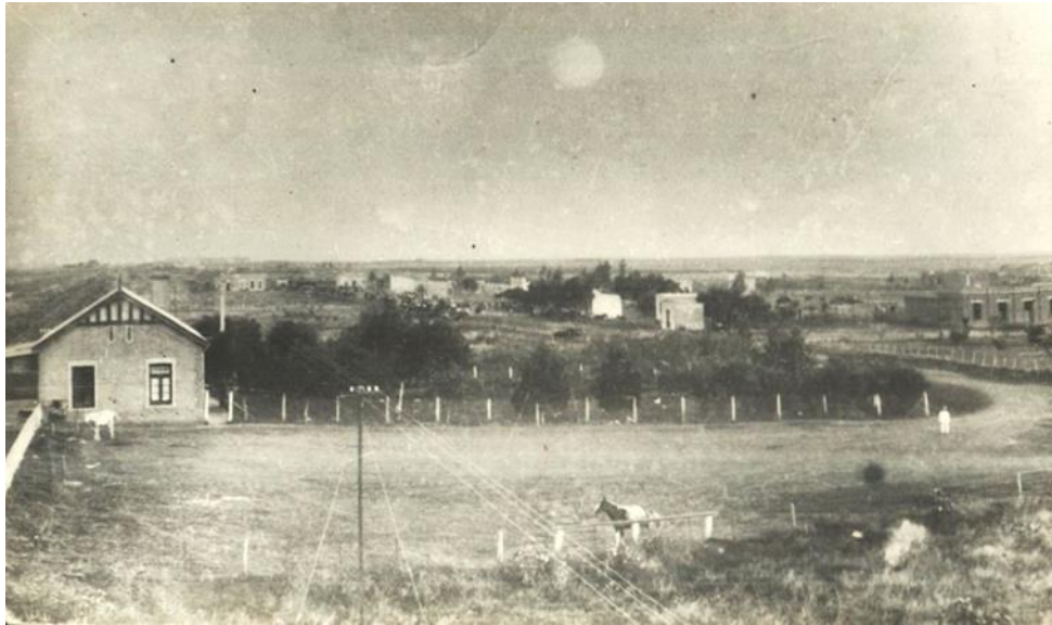
Figura 5: Foto de la ciudad de Verónica en la década de 20.

En esa fotografía se ve al fondo la llanura pampeana, con su configuración rectilínea, distinta de la geometría más vertical de los primeros planos. Ahí se retrata un pequeño núcleo urbano con árboles y vegetaciones cultivadas de apariencia arbustiva. El primero plan de la foto nos ofrece una serie de informaciones, como la arquitectura de la época, los caballos allí parados, probablemente usados como transporte, la presencia de la electricidad, las cercas ya alambradas - y no naturales - y los montes que marcan e identifican la presencia humana en contraste con inmensa la llanura. O sea, entre los otros elementos, tanto la arquitectura cuanto la vegetación circundante son intervenciones que narran igualmente la historia de la actual ciudad de Verónica.