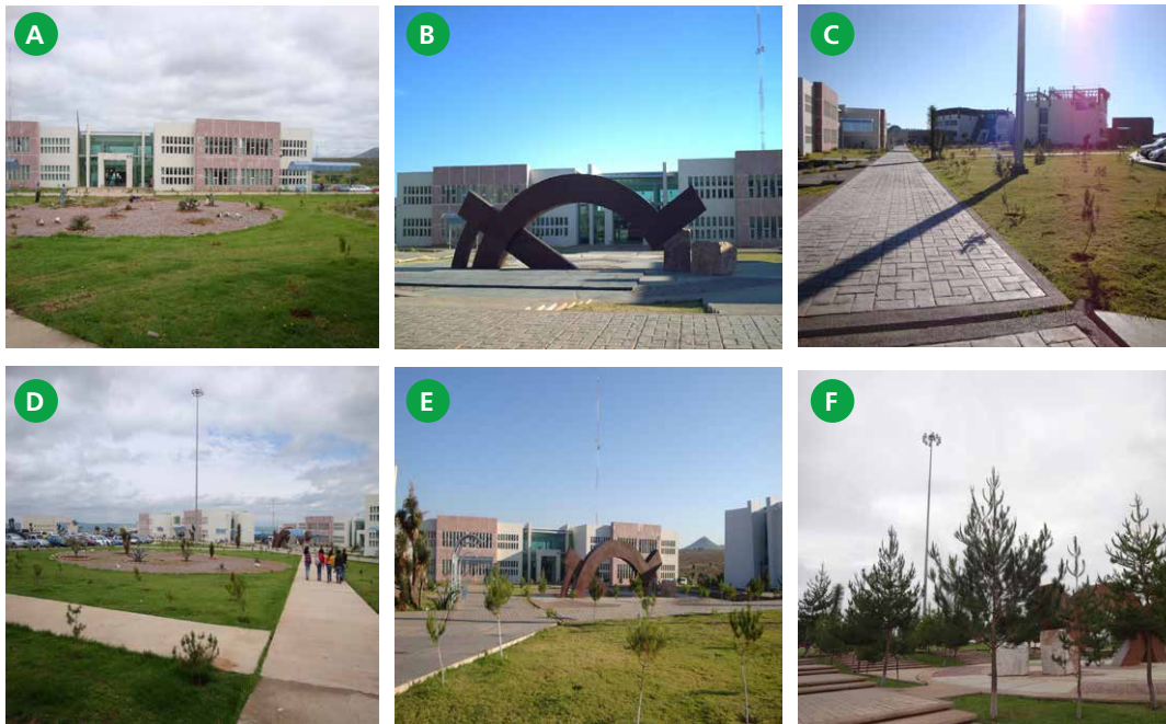
Figura 2. Evolución del desarrollo del proceso de forestación en el Campus UAZ Siglo XXI (2008-2016).

La Universidad Autónoma de Zacatecas siempre ha manifestado su intencionalidad en lo que se conoce como misión institucional, la cual consiste en educar y formar profesionistas emprendedores, responsables y honestos. Sustentada además, en una sólida formación humanística, científica, tecnológica y respetuosa del medio ambiente.