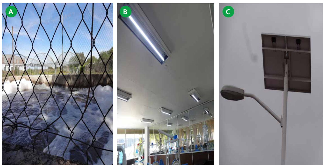
Figura 4. (A) Planta tratadora de aguas primera fase. (B) Utilización de lámparas ahorradoras en una clínica odontológica de la UAZ. (C) Lámpara con celdas solares.

1. Socialización de la estrategia, establecimiento de una agenda ambiental: Gestión Ambiental y Ambientalización de las Curriculas.