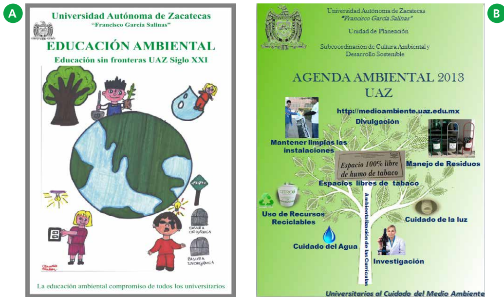
Figura 1. Agenda Ambiental UAZ. (A) Utilizada en 2006-2012, (B) 2013-2016.

prestigiadas del país. En ese año también se inició los estudios de Ingeniería.