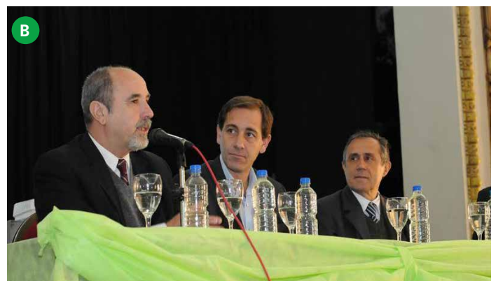
Figura 8. (A) Se muestra Figura de los libros publicados de los trabajos en extenso (2016) del cuarto congreso internacional de Cambio Climático y Desarrollo Sostenible en 2013. (B) Inauguración del quinto congreso internacional de Cambio Climático y Desarrollo Sostenible por el Presidente de la Universidad Nacional de la Plata el Dr. Raúl Perdomo en la Ciudad de la Plata Argentina, septiembre 2016.