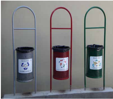
Figura 3. Contenedores instalados en todos los espacios universitarios para separación de residuos: aluminio, residuos inorgánicos y orgánicos.

un medio ambiente que les permita aspirar a una vida de calidad y digna.