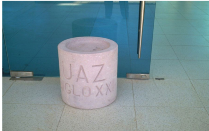
Figura 2. Cenicero colocado en la puerta del Edificio 1 del Área de Ciencias Salud UAZ. 2008.

otros niveles jurisdiccionales) medidas eficaces que protejan de la exposición al humo de tabaco en lugares de trabajo interiores, transportes públicos, lugares públicos interiores y, según convenga, otros lugares públicos.