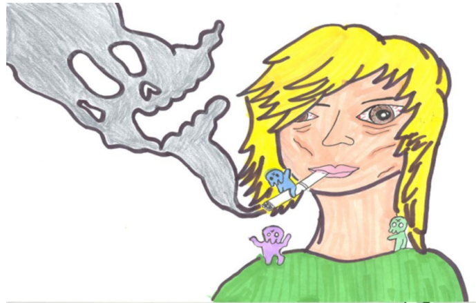
Figura 1. Pictograma en la campaña antitabaco UAZ, el humo del tabaco causante de morbilidad y mortalidad en el ser humano en fumadores pasivos y activos (Dibujo Claudia Muñoz M-2007)