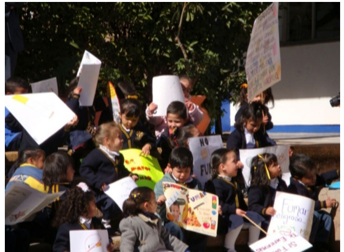
Figura 5. Comunidad CECIUAZ, el día de su reconocimiento como espacio 100% Libre de Humo de Tabaco.

En la segunda etapa se certificó 45 espacios de la UAZ (2013).