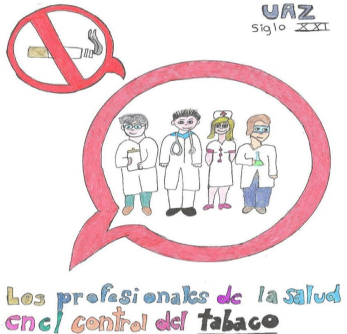
Figura 3. Publicidad en todos los edificios del Campus UAZ Siglo XXI (Dibujo Claudia Muñoz M. 2007).

Art. 1.- El presente Reglamento tiene por objetivo la protección de la salud de los no fumadores en Rectoría y así mismo invitar a los fumadores a respetar el edificios de la Administración Central