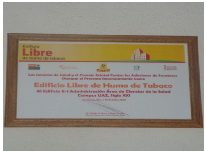
Figura 6. Reconocimiento del edificio E1 del Área de Ciencias de la Salud (2008).