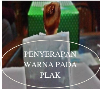
Gambar 1. Hasil pengujian penyerapan plak dari buah gendola (kelompok perlakuan)