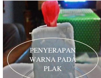
Gambar 2. Hasil penyerapan plak pada disclosing solution (kelompok kontrol)