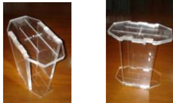
Gambar 1. Alat pengujian FFD

dengan dimensi tinggi 21 cm x 10 cm, sisi atas berbentuk segi delapan dengan panjang 18 cm x 10 cm dan terdapat beberapa ukuran kawat sebagai panduan ukur FFD yang diatur seperti pada gambar 1.