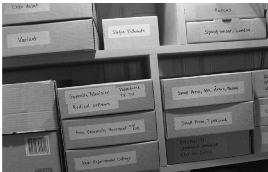
Fig. 2. Archivo. Universidad Libre de Copenhague. Cortesía de Jakob Jakobsen.