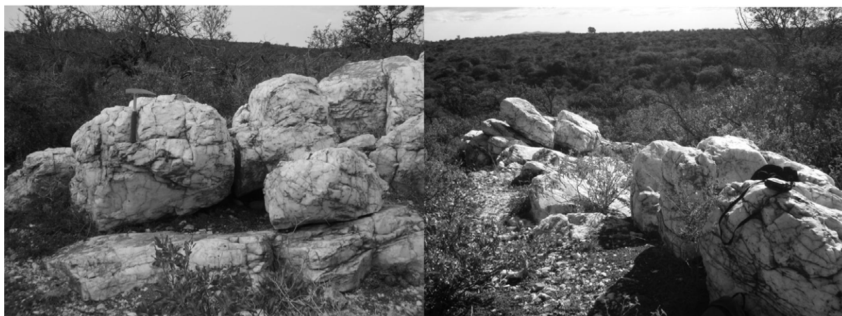
Figura 2. Cantera-taller Piedra Blanca.

denominada Piedra Blanca (Cattáneo 1994; Laguens 1999) (Figura 1) que posee una longitud de 72 m y 2 m de potencia.