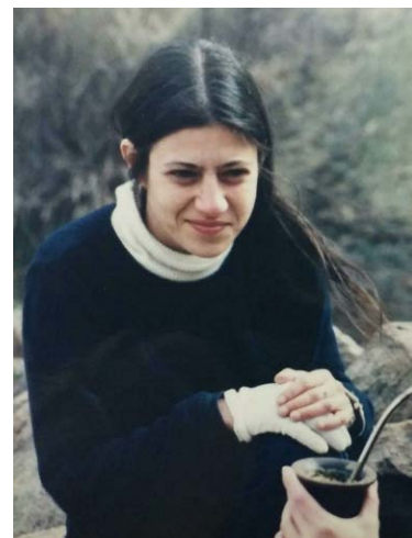
Figura 1. Campaña en Rincón del Toro, La Rioja. Agosto, ca. 2000.

Ordenemos un poco el relato. Marina completó su formación escolar y universitaria en instituciones públicas: cursó sus estudios primarios en la Escuela N° 21 "General José de San Martín" de Bernal —su barrio de toda la vida— y los secundarios en la Escuela Nacional Normal de Quilmes, localidad en la que nació. Inició la carrera de Ciencias