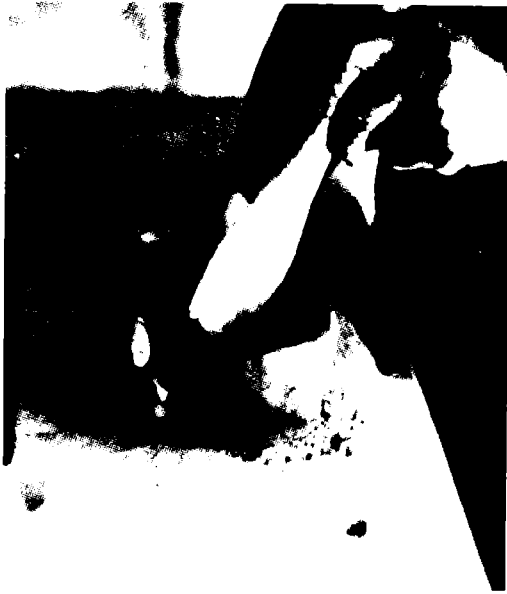
Fig. 4. Alisado de la pared interna de la base.