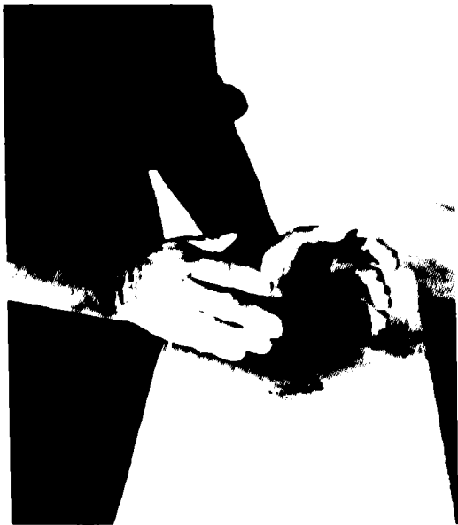
Fig. 2. Disco de arcilla, a partir del cual, por ahuecamiento, se modela la base de la pieza.