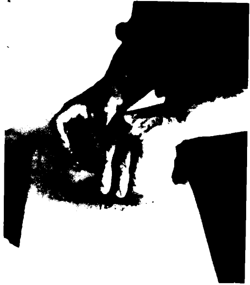
Fig. 5. Agregado de un rollo de arcilla para modelar el cuerpo de la pieza.