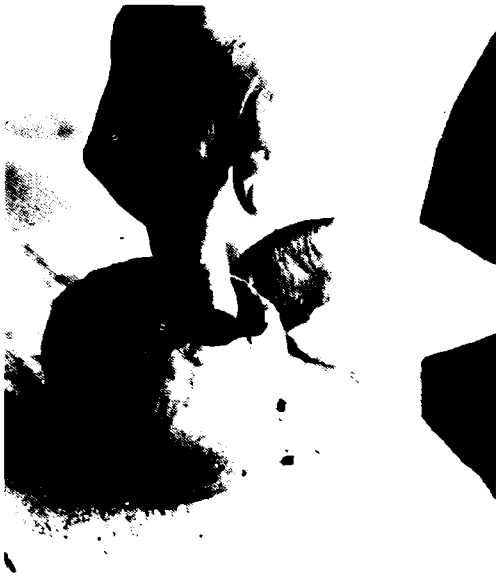
Fig. 6. Alisado de la pared externa del cuerpo.