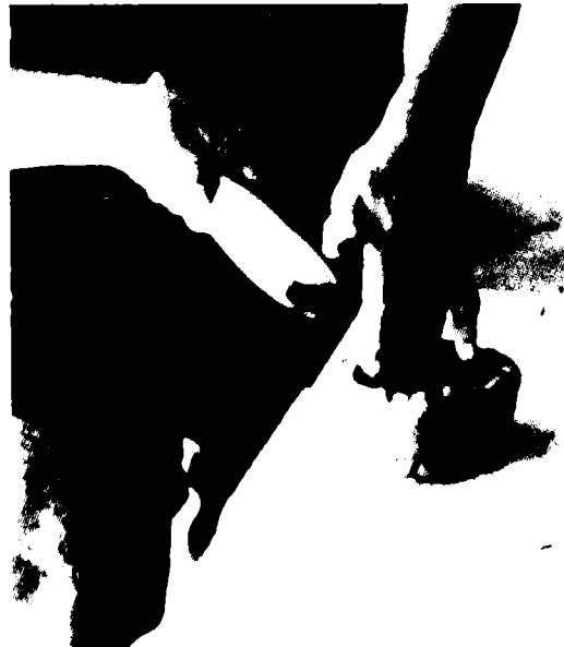
Fig. 3. Alisado de la pared externa de la base.