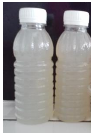
Gambar 2. Sampel Minuman Jeli Ikan Lele Terpilih

Sampel terpilih dilakukan analisis kadar protein dengan metode Kjeldahl dan kadar serat kasar dengan metode Gravimetri.