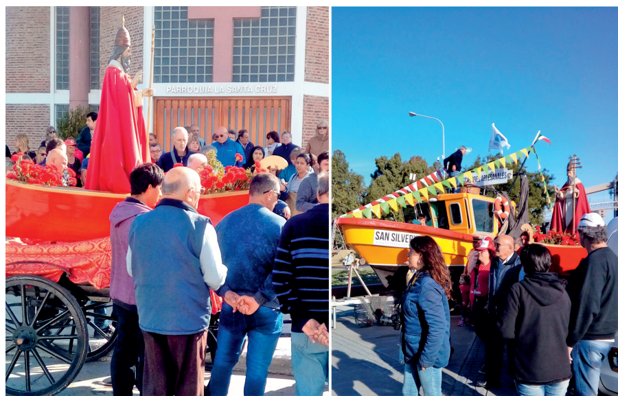
Figura 5. Celebración de San Silverio, en honor al patrono de los pescadores y del puerto

Respecto del estado de conservación del legado histórico de la localidad, la mitad de las respuestas de los entrevistados aludieron a un estado regular de preservación, y señalan la carencia de inversión por parte del Estado o los agentes privados en el mantenimiento de los edificios. Asimismo, el abandono de algunas obras fue una variable reiterada en las respuestas. En este sentido, expresó una de las vecinas: “Los edificios que hoy funcionan están en buen estado, por el cuidado de quienes lo mantienen; no así otros edificios que han sido emblemáticos, pero hoy se encuentran en total estado de abandono y deberían ser considerados patrimonio histórico” (Karina, vecina de la localidad, 2017).