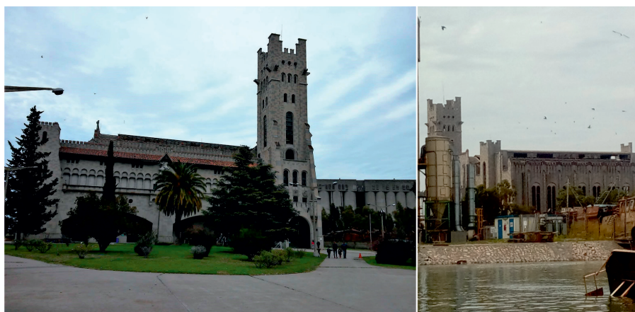
Figura 4. Ex Usina General San Martín, parte actual del complejo Museo-Taller Ferrowhite