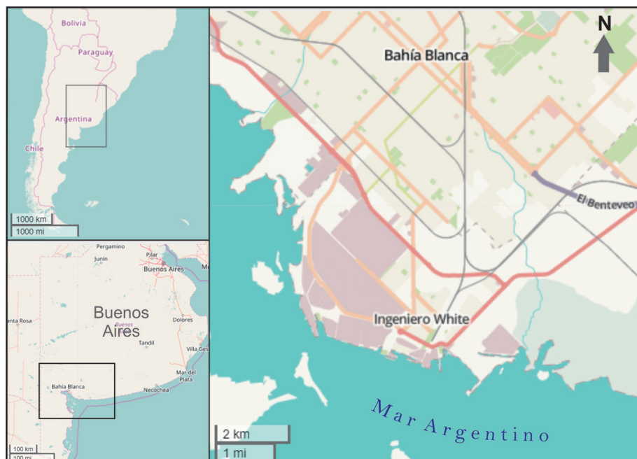
Figura 1. Localización de Ingeniero White

La localidad de Ingeniero White –emplazada en el partido de Bahía Blanca, en el sudoeste de la provincia de Buenos Aires (Figura 1)– surge como resultado de la actividad portuaria. Los primeros desarrollos, de carácter precario, se manifestaron a finales de la década de 1850 en la desembocadura del arroyo Napostá. En 1858 se construyó en este lugar el primer muelle rudimentario, que posibilitaba el ingreso de mercancías procedentes de Buenos Aires con destino a Bahía Blanca. Durante el decenio de 1880, con base en las inversiones del Ferrocarril Sud, se llevaron a cabo las primeras instalaciones, y en 1885 se inauguró el primer muelle de hierro (Bróndolo y Zinger, 1978; Viñuales y Zingoni, 1990). El gran auge del puerto, adicionado a los procesos inmigratorios, condujo a que la localidad comenzara a expandirse, y a la urbanización del área aledaña. Este desarrollo, ligado al ferrocarril y al puerto, implicó la creación de diferentes edificios y equipamiento puntual destinados a funciones vinculantes: elevadores, usinas y talleres, entre otros. Dichas obras, articuladas con aquella arquitectura modesta, de