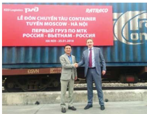
Рис. 3. Встреча первого контейнера во Вьетнаме из России.

Программа подготовки специалистов высшей квалификации предусматривает двухгодичное обучение: подготовительное отделение +1 курс в университете транспорта и коммуникаций (Вьетнам, г. Ханой) и четырёхгодичное обучение в РУТ (МИИТ). Сейчас в Москве обучается 10 человек, граждан Вьетнама, и им