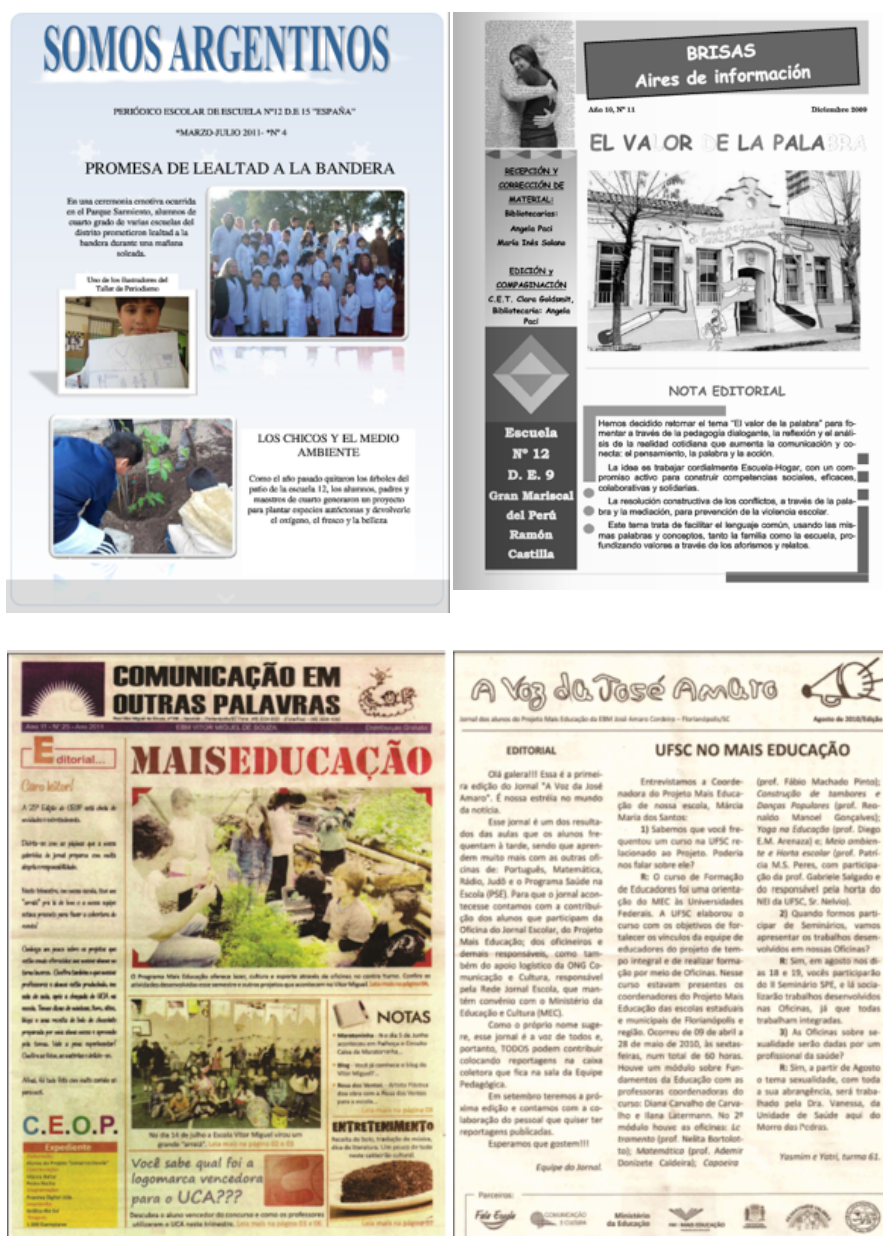
Figura 1: Periódicos analizados.

Las cuatro escuelas están ubicadas en barrios de clase media, y la población escolar que tienen a cargo pertenece a estratos socio-económicos medios y medio-bajos.