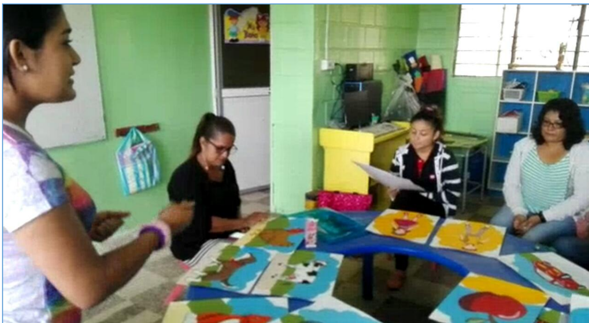
Figura 3. Focus Group - Validación de la propuesta.

Para un mejor aporte al trabajo de titulación se ha recurrido a la validación de la propuesta, la cual permite demostrar el grado de aceptación del proyecto realizado, esto se ha llevado a cabo por medio de dos procesos, el primero denominado focus group y el segundo llamado testeo.