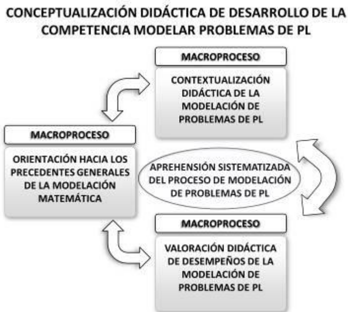
Fig. 1.- Conceptualización didáctica de desarrollo de la competencia modelar problemas de PL

La conceptualización didáctica para el logro de la competencia modelar problemas de PL, consta de tres macroprocesos que pueden denominarse: orientación didáctica hacia los precedentes generales de la modelación matemática; contextualización didáctica de la modelación de problemas de PL en las carreras de ingeniería y valoración didáctica de desempeños de la modelación de problemas de PL, de cuya sinergia y relaciones se logra una aprehensión sistematizada del proceso de modelación de problemas de PL (Ver Fig. 1).