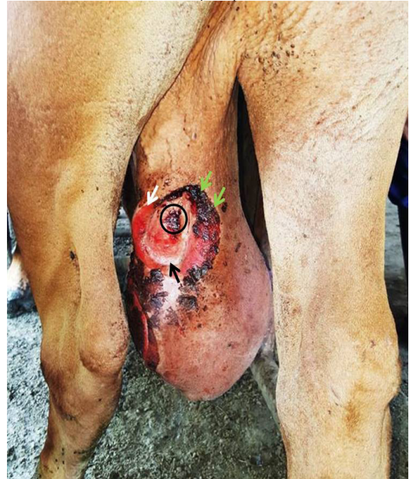
Figura 1. Osqueítis ponzoñosa en un toro. Observe la severa dermatitis necrótica, con presencia de un punto necrótico central (círculo), un halo blanco medial (flecha negra), un halo violáceo más externo (flecha blanca) y un área de necrosis progresiva (flechas verdes).

Posteriormente, previa sedación (Acepromacina 1%, Zoo®, Colombia) y aplicación de anestesia local (Lidocaina 2%, Synthesis®, Colombia) fue tomada una biopsia de tejido desde la periferia de la lesión necrótica (CARDONA et al. , 2013), con punch de 6 mm, posteriormente fijada en formol al 10% y llevadas al laboratorio de Patología del Departamento de Ciencias Pecuarías de la Universidad de Córdoba, Colombia, donde fueron procesadas hasta su inclusión en parafina. Posteriormente, la muestra fue teñida con la coloración de Hematoxilina - Eosina (H-E).