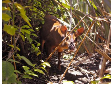
Figura 2. Venado temazate rojo ( Mazama temama ) hembra, municipio de Eloxochitlán, Sierra Negra de Puebla, México