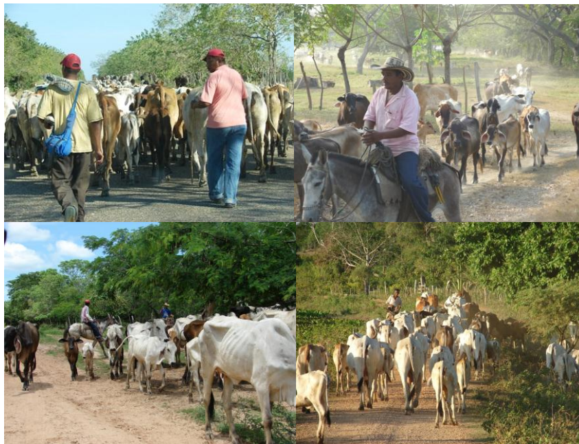
Figura 2. Imágenes de la trashumancia en la zona de estudio

Tomando como municipios representativos por su arraigo ganadero y por las evidencias tradicionales de trashumancia, se tienen, para este estudio, en la