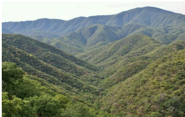
Figura 1: Cerriles de la UMA ejido San Miguel, Chiautla, Puebla, México.